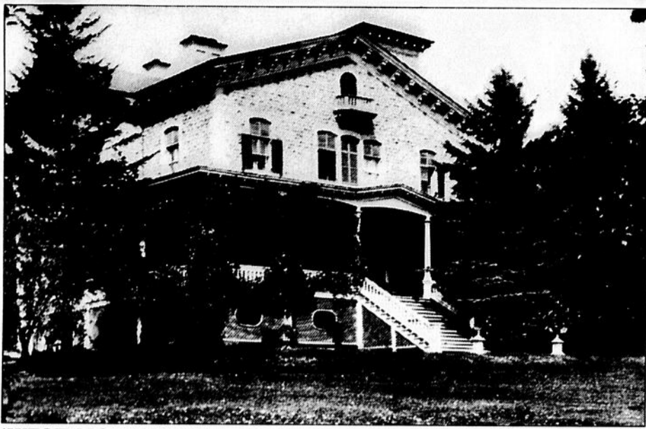
'WEST MOUNT': This is the name given by William Murray to the fine family home which the shipping line owner built above the steepest slope of Cote road. [It stood here until it was demolished in 1920 and Murray Park was established.]