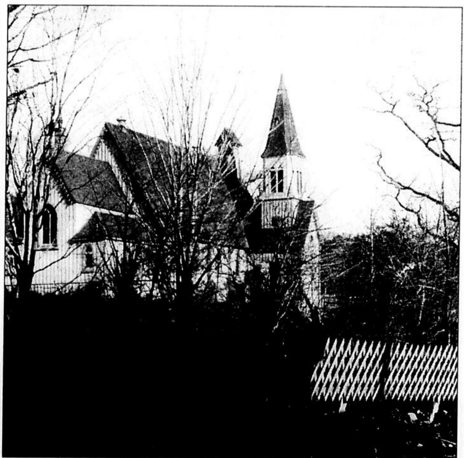
OUR ONLY CHURCH: St Matthias, the only church in our village, belonging to the Anglican persuasion, though expected to be joined by others as our little community is bound to grow. The land was donated by the Raynes family from their "Forden" estate.

One might expect that this property promotion has encouraged the creation of the Village of Notre Dame de Grâce, expecting the demand for good homes to extend into the adjacent new municipality — despite the current evidence of depression in the wider Montreal area.