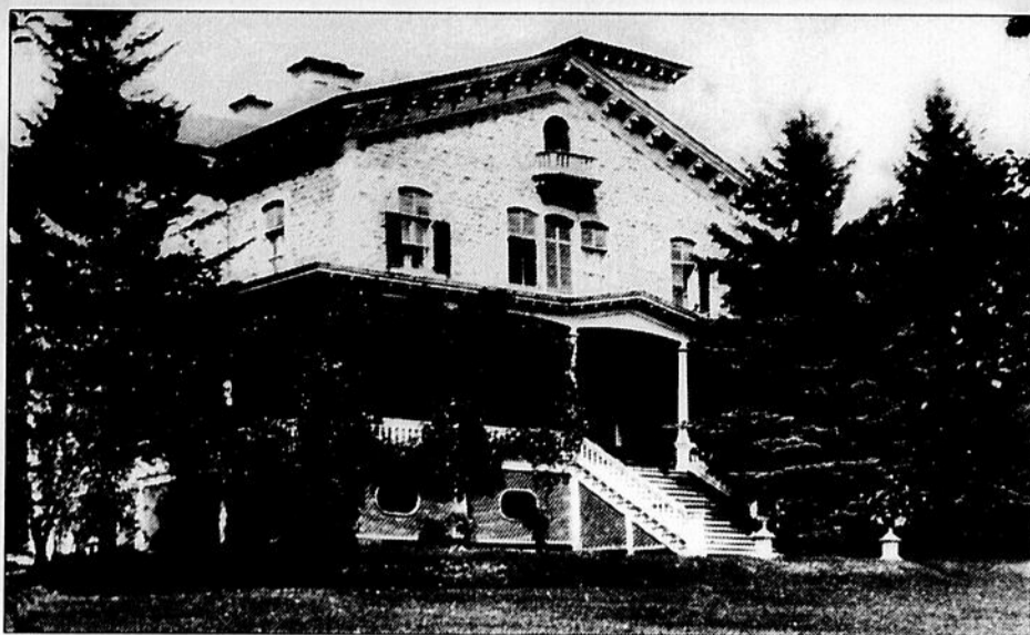
«West Mount» C'est le nom que l'armateur William Murray a donné à sa belle maison familiale construite au sommet de la pente la plus abrupte du chemin de la Côte. (La maison y a été jusqu'à ce qu'on la démolisse, en 1920, pour aménager le parc Murray.)