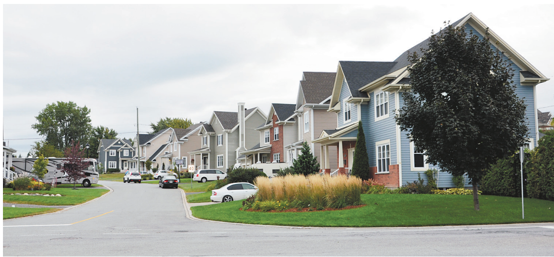
LOÏC HAMON LE DEVOIR

Cet étalement urbain a provoqué un réel boom des projets résidentiels dans les couronnes nord et sud de Montréal. « Le hic avec la majorité de ces développements, c'est qu'ils ne sont pas accompagnés d'une réflexion préalable sur la mobilité. Il faudrait une planification intégrée qui tient compte des besoins de transports