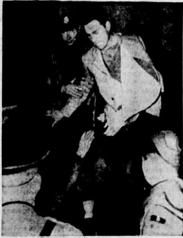
Des soldats anglais aident un aviateur nazi blessé à descendre d'un wagon à la gare de Londres. Cet aviateur capturé quelques heures plus tôt est conduit à un camp d'internement. (Approuvé par les censeurs britanniques).