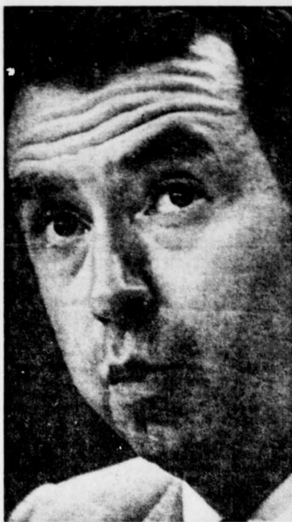
Le chef conservateur Joe Clark

Par exemple, ajoute-t-il, en fonction du coefficient d'occupation et du rapport recettes-dépenses d'une ligne qu'on a décidé d'abandonner comme celle reliant Montréal et Sherbrooke, il en coûte quelque $25 le billet au gouvernement, le prix d'un