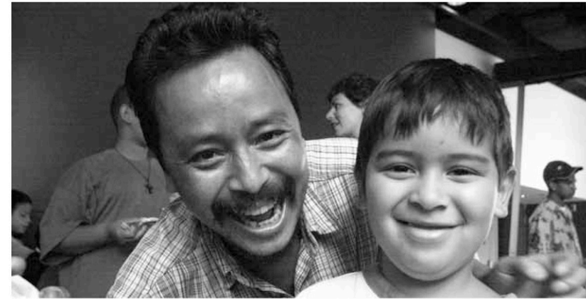
Journée portes ouvertes, en 2002

Faire un retour sur ces dix années, c'est faire état d'une action citoyenne menée en direction d'une communauté exclue qui est pourtant située au cœur d'un grand développement culturel montréalais, le Quartier des spectacles. Je parle ici des Habitations Jeanne-Mance, un complexe immobilier voisin de la Maison Théâtre, abritant près de 450 jeunes de moins de 18 ans. Il était donc naturel, voire essentiel, que nous arrivions à tisser des liens de proximité avec cette communauté.