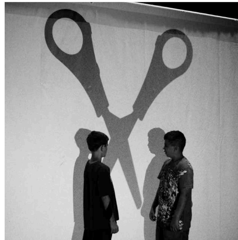
Camp pédagogique Sortir de l'ombre, réalisé avec l'école secondaire Pierre-Dupuy, août 2010

Au-delà des statistiques, c'est la cohésion d'action de tout un milieu, la collaboration avec des organismes et des intervenants et la durée dans le temps qui rendent l'intervention de la Maison Théâtre significative auprès des jeunes de tous âges et de leur famille. De plus, la présence de la Maison Théâtre dans les écoles, à certains comités et sa participation à plusieurs consultations l'ont positionnée comme un joueur clé dans le développement de la qualité de vie de l'arrondissement.