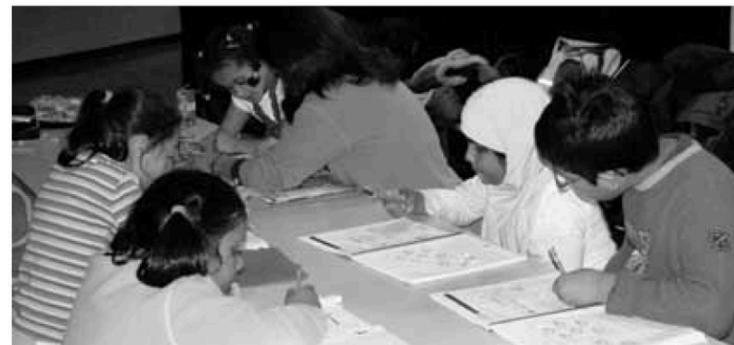
Marier apprentissages scolaires et théâtre © Maison Théâtre

Offerte aux enfants des HJM du 1 er cycle ciblés par l'orthopédagogue de l'école Marguerite-Bourgeoys, cette activité unique leur permet de développer leur créativité, de canaliser leur énergie et d'affirmer leur personnalité dans un cadre stimulant.