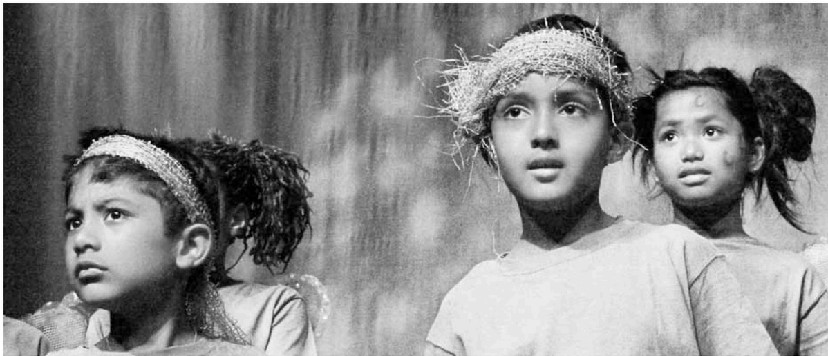
Spectacle de fin d'année de Coup de pouce théâtre, juin 2011