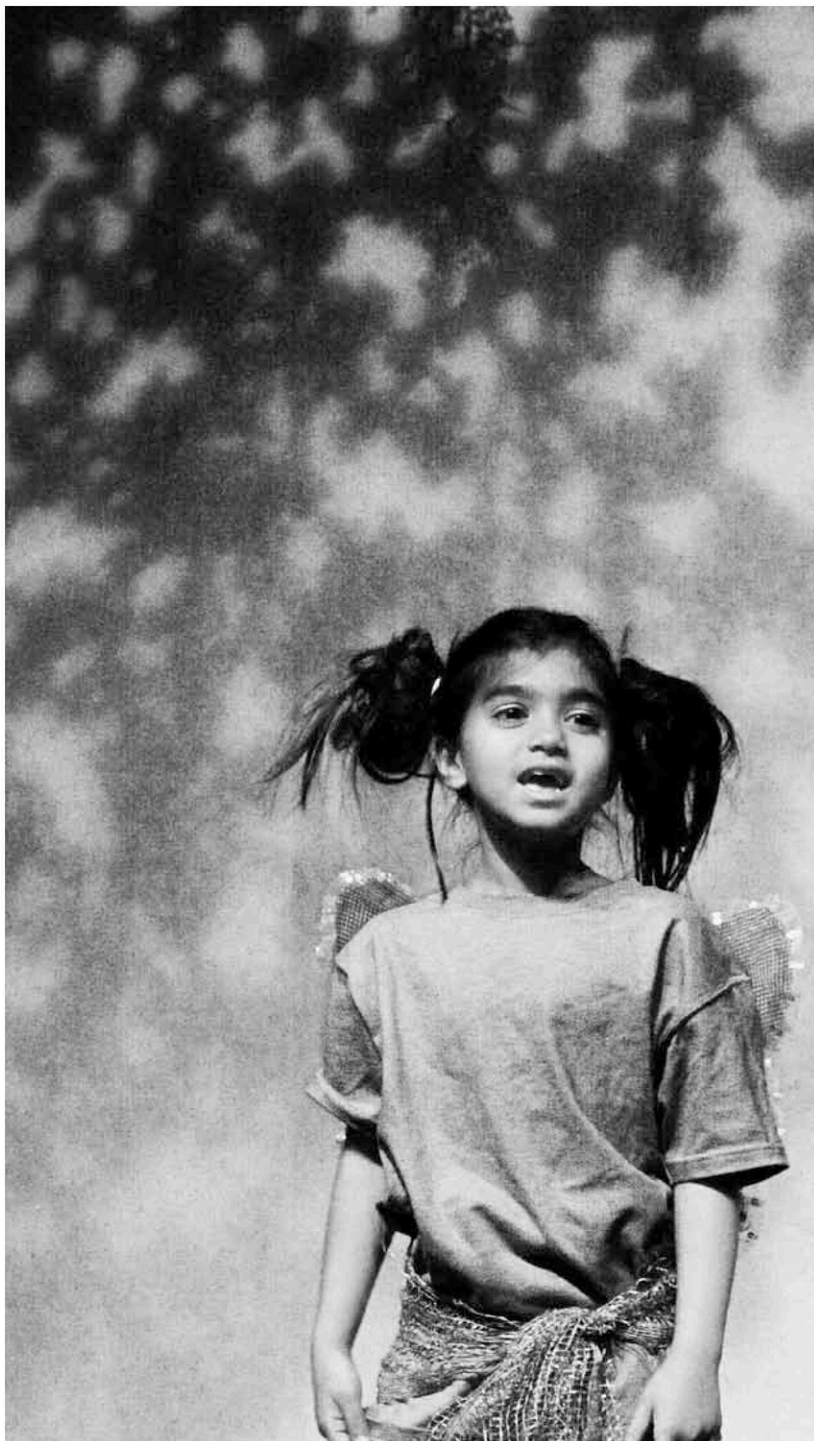
Après les devoirs... la scène. © Maison Théâtre