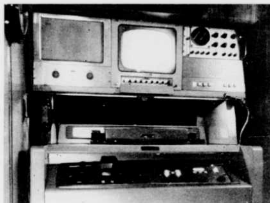
Le magnétoscope du car d'enregistrement