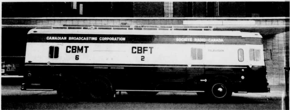
« Jocelyne », l'un des cars de reportages