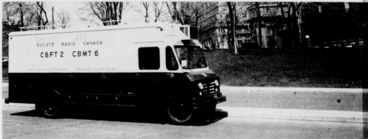
Le car d'enregistrement

SUIVRE DE TRÈS PRÈS LE RHYTHME DE L'ACTUALITÉ