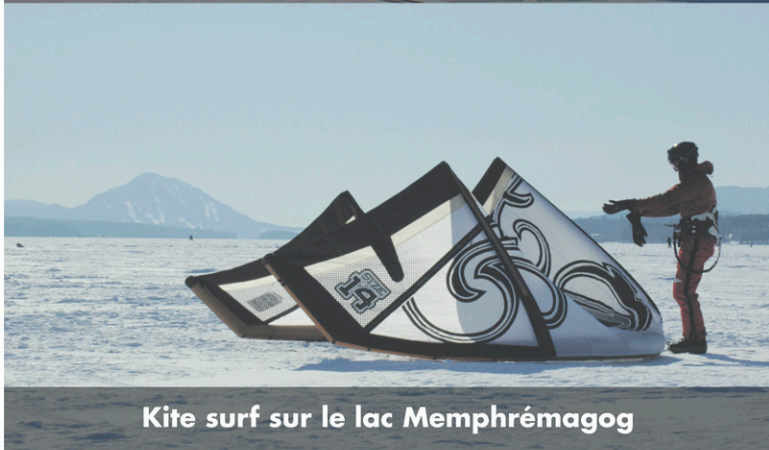
Kite surf sur le lac Memphrémagog