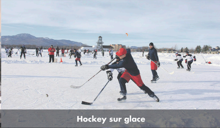
Hockey sur glace