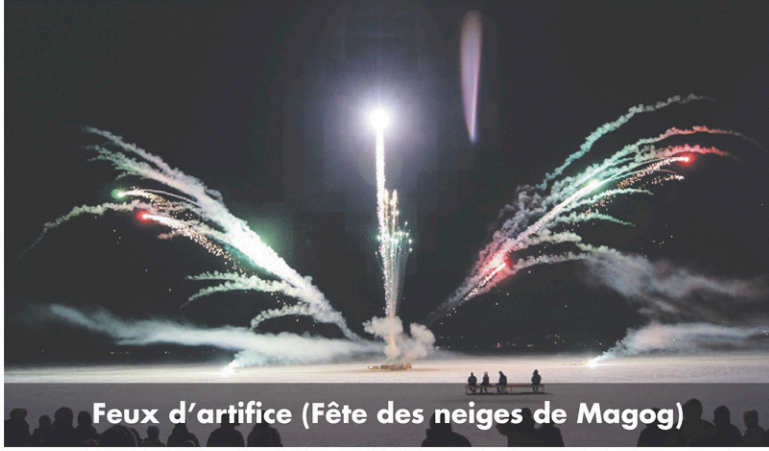
Feux d'artifice (Fête des neiges de Magog)