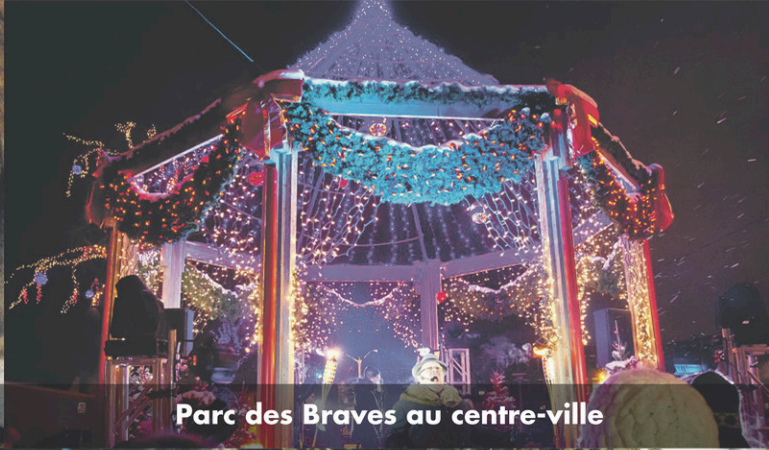
Parc des Braves au centre-ville