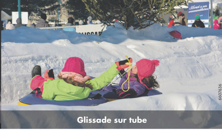
Glissade sur tube