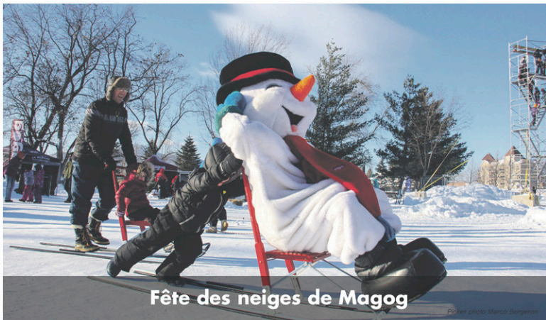
Fête des neiges de Magog