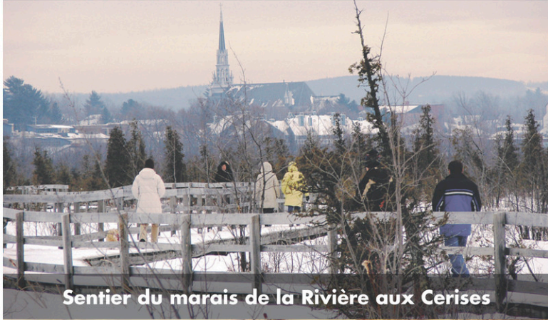
Sentier du marais de la Rivière aux Cerises