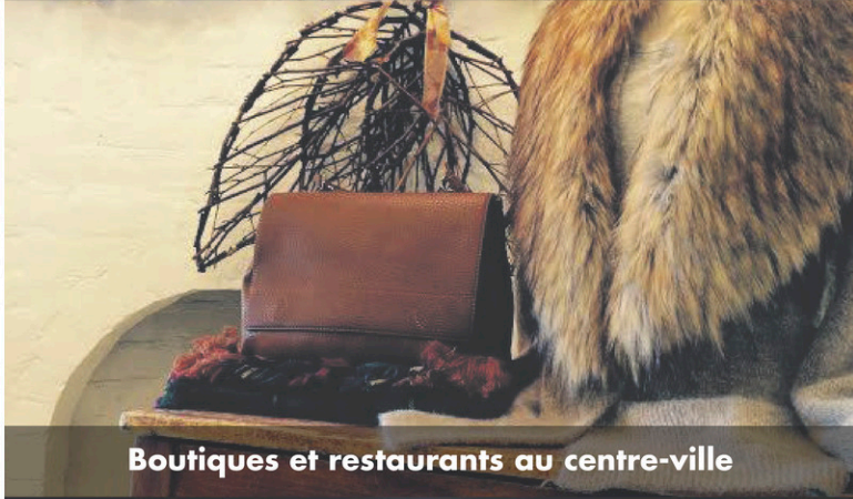
Boutiques et restaurants au centre-ville