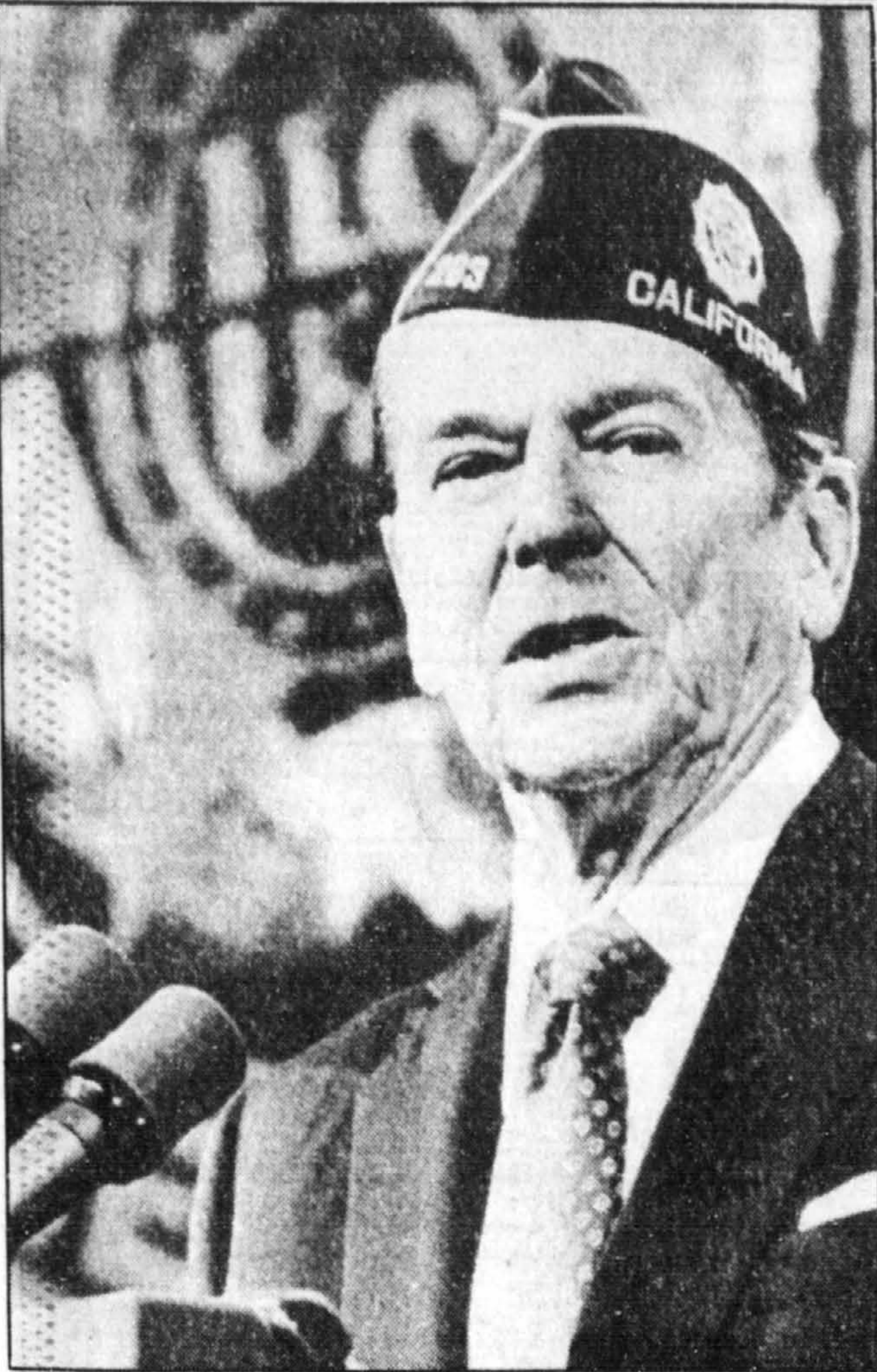
Le président Reagan devant le congrès de l'American Legion à Seattle.