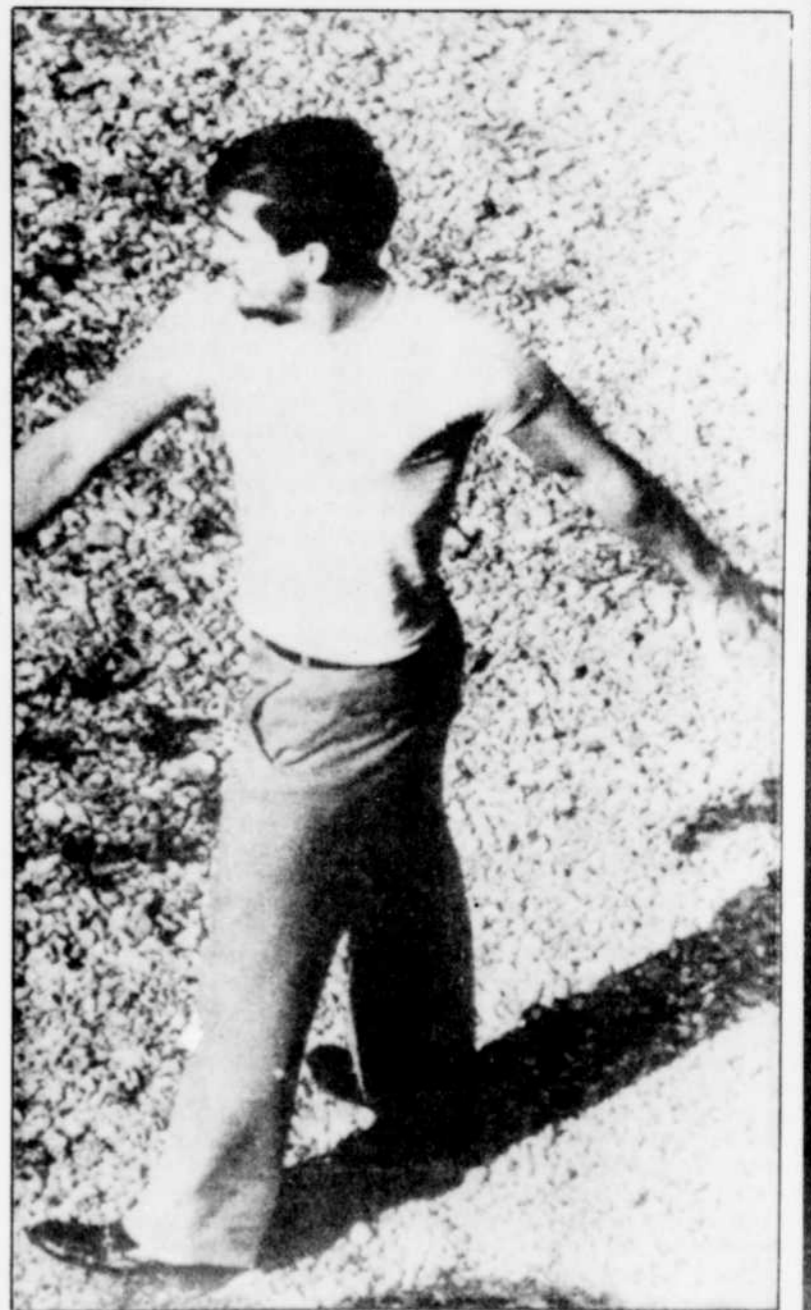
Les otages en action

M. Ghassemlou a cependant exclu que les Kurdes rompent unilatéralement le cessez-le-feu, qui expire le 14 décembre.