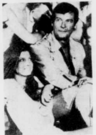
Roger Moore et sa cour.

Mais il ne s'agit encore que de rôles secondaires et le beau Roger ronge son frein en attendant de connaître de vrais succès.