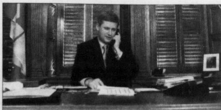
Stephen Harper au travail cette semaine.

En fait, Stephen Harper avait commencé le travail près de deux semaines auparavant, dès le lende-