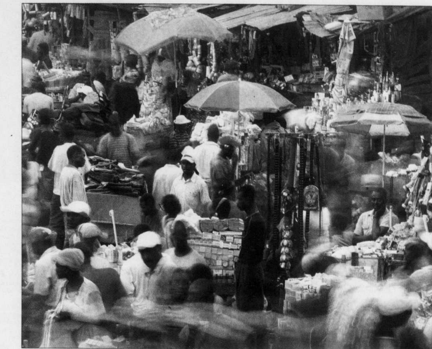
La vie a repris son cours normal à Port-au-Prince.