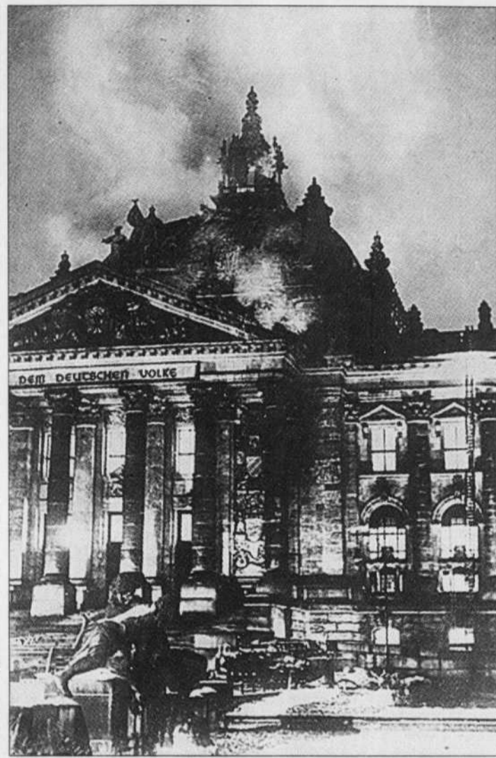
Le Reichstag en flammes (source de la photo: history.acusd.edu/gen/WW2Timeline/Prelude03.html).

de l'édifice un jeune homme de 24 ans qui a déclaré s'appeler Van der Luebbe et venir d'Amsterdam et qui aurait admis avoir mis le feu pour tirer vengeance contre le capitalisme.