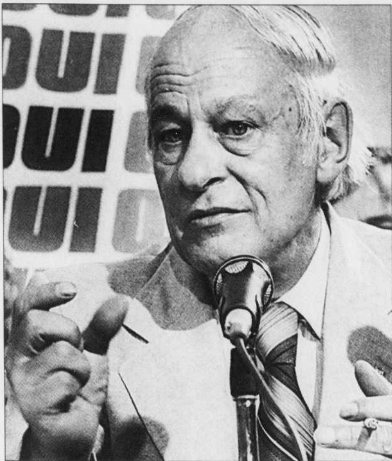
René Lévesque en 1980

En ce qui concerne les relations internationales, Godin démontre parfaitement que, malgré ce qu'en disent certains, le ministère des Affaires étrangères canadiennes a été, pendant cette période et jusqu'à aujourd'hui d'ailleurs (avec un bref intermède sous Brian Mulroney), cette machine à écraser le Québec que tous ceux qui ont œuvré dans ce secteur connaissent trop bien. M. Lévesque exérait la plu-