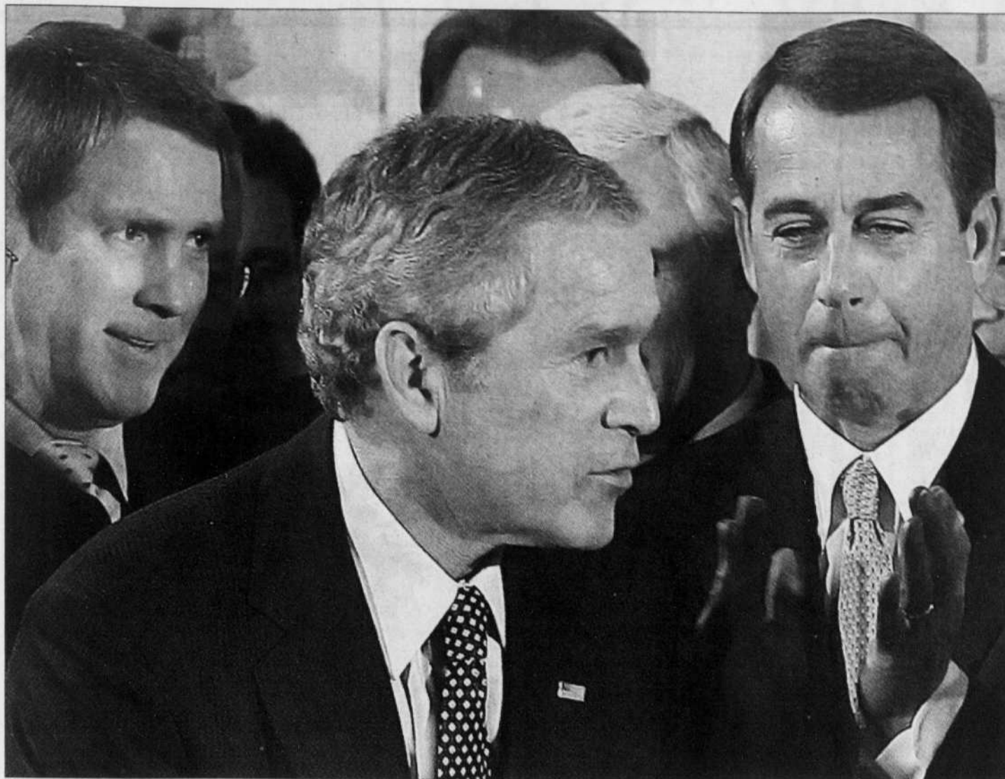
Le président George W. Bush lors de la signature de la loi sur le déficit.