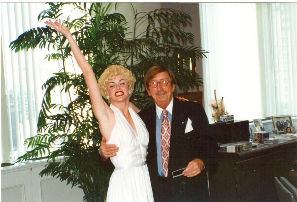
Pierre Péladeau lors de son anniversaire du 12 avril 1996 avec une actrice en personnage de Marilyn Monroe