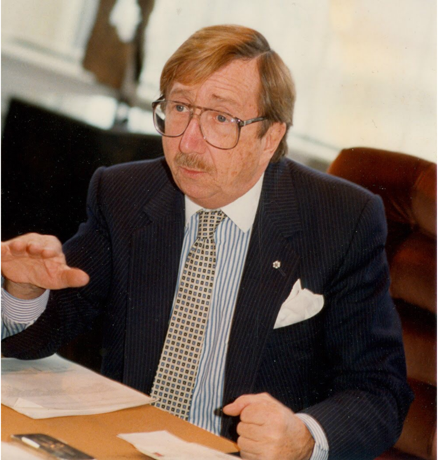
Pierre Péladeau - 1991