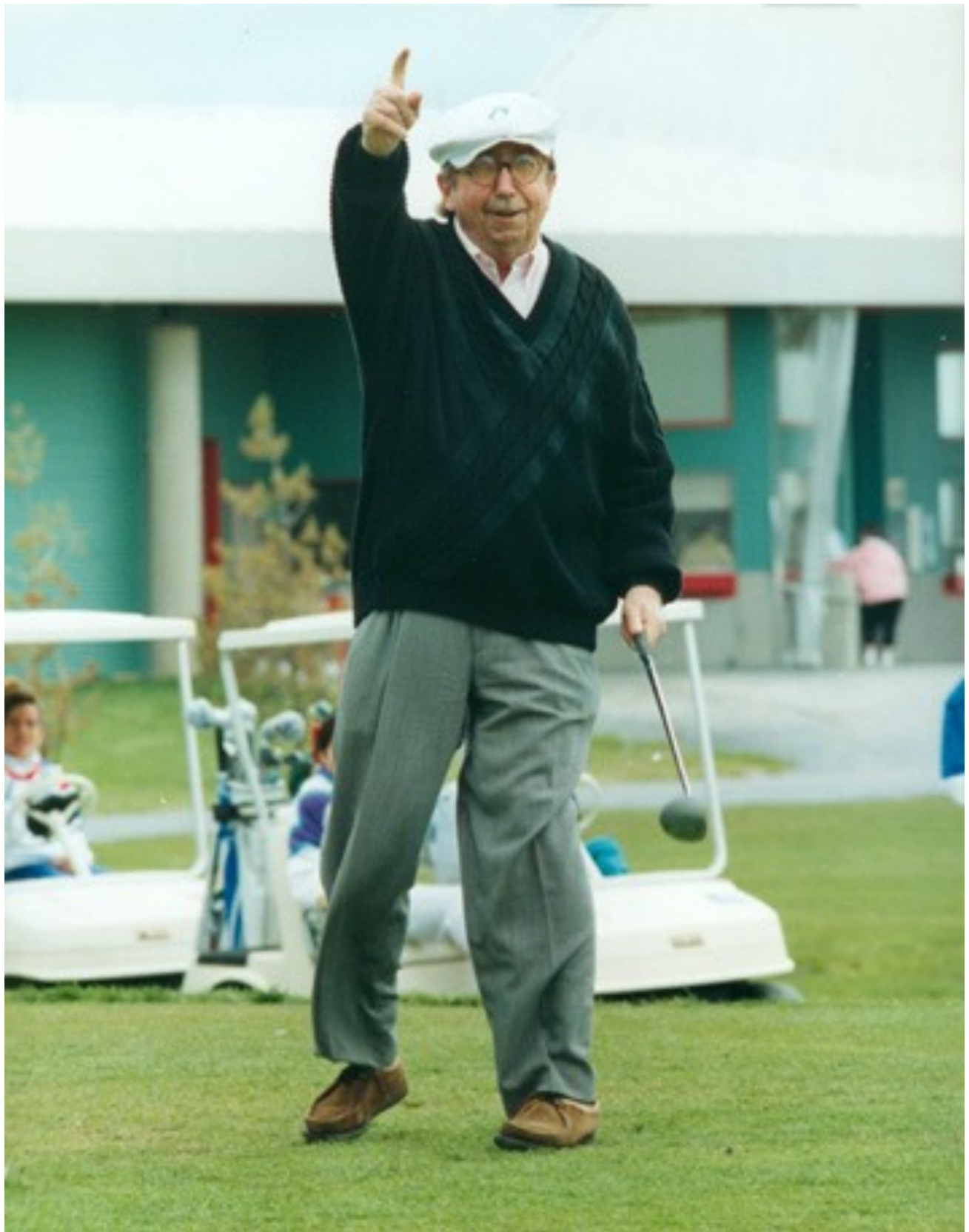
Pierre Péladeau - 1995