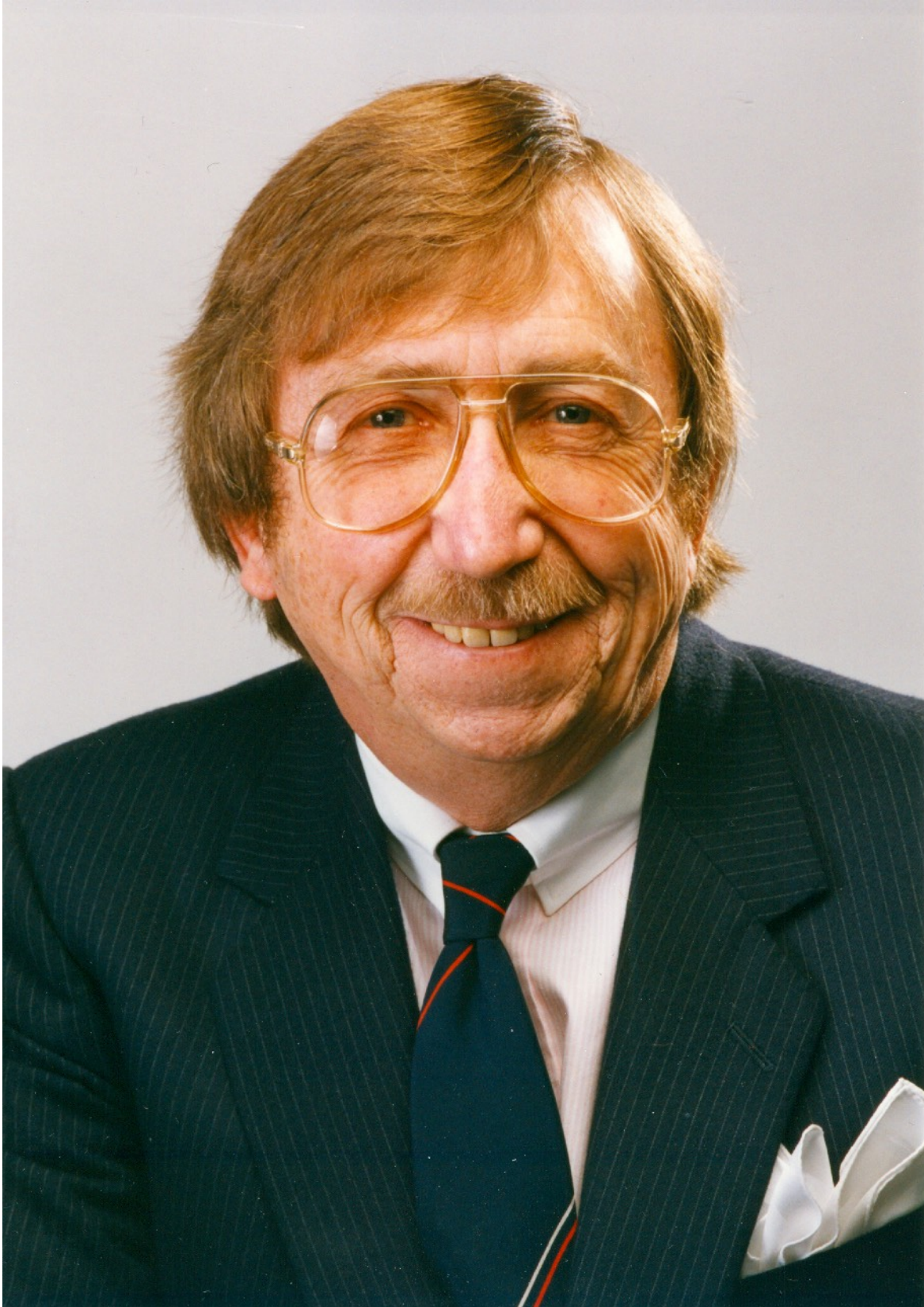
Pierre Péladeau et sa photo promotionnelle