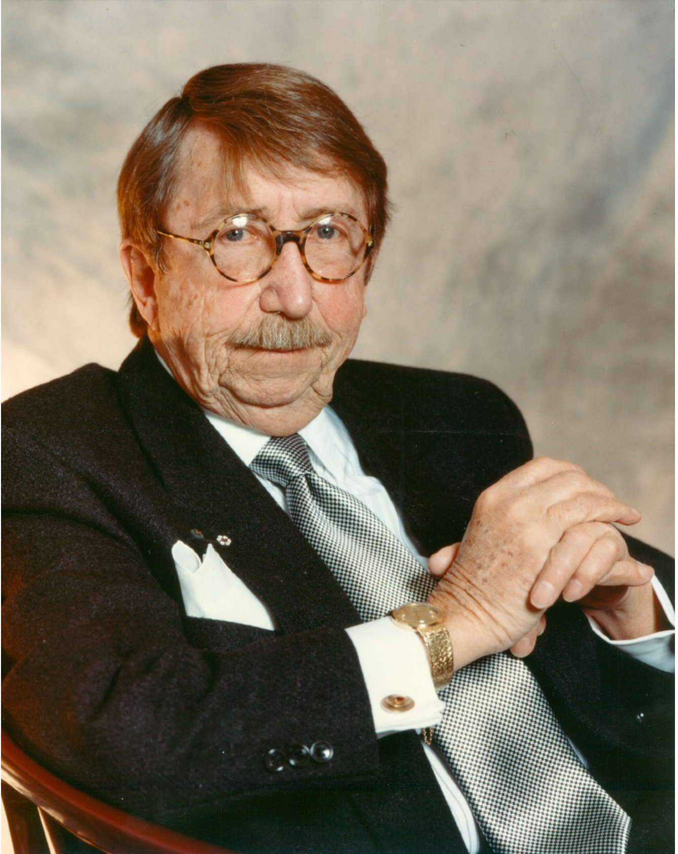
Pierre Péladeau - 1996