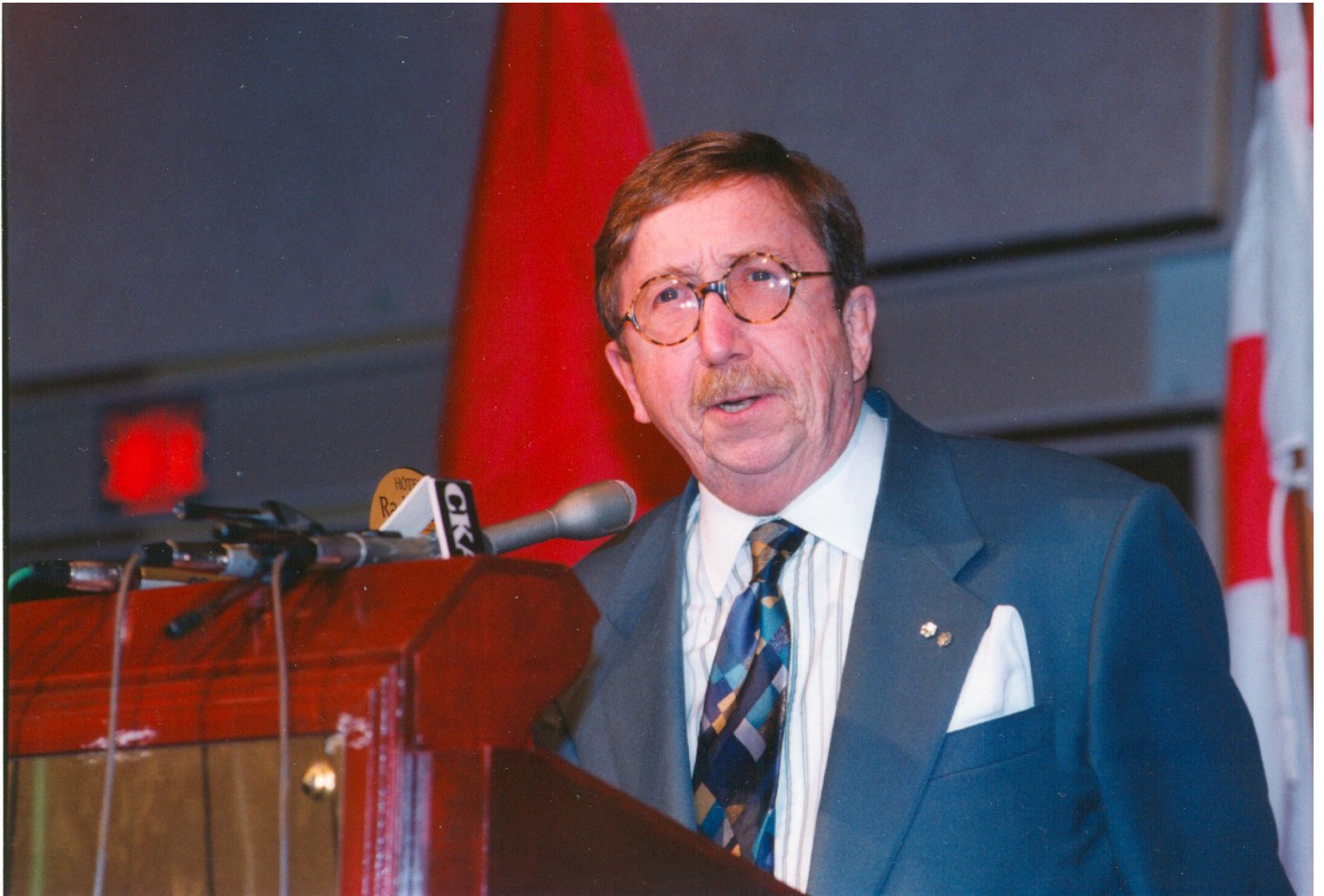
Pierre Péladeau -1995