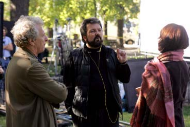
Le réalisateur Michel Poulette (au centre)

Le cinéma québécois est en plein élan et plusieurs productions québécoises se démarquent. C'est le cas, entre autres, du réalisateur Michel Poulette qui vient de lancer son nouveau film: «Histoire de famille» qui sera en salle dès le 27 janvier au Québec. L'histoire tourne autour d'une famille aux prises avec la révolution tranquille pendant les années 1960. Poulette a plusieurs succès à son actif notamment à la télévision et au cinéma. Le réalisateur croit beaucoup aux possibilités du cinéma numérique en particulier pour faciliter la distribution en région. On sait que l'industrie du cinéma est inquiète devant ce nouveau développement technologique qui viendra bouleverser le fonctionnement des salles de cinéma mais Poulette ne fait pas partie du nombre.