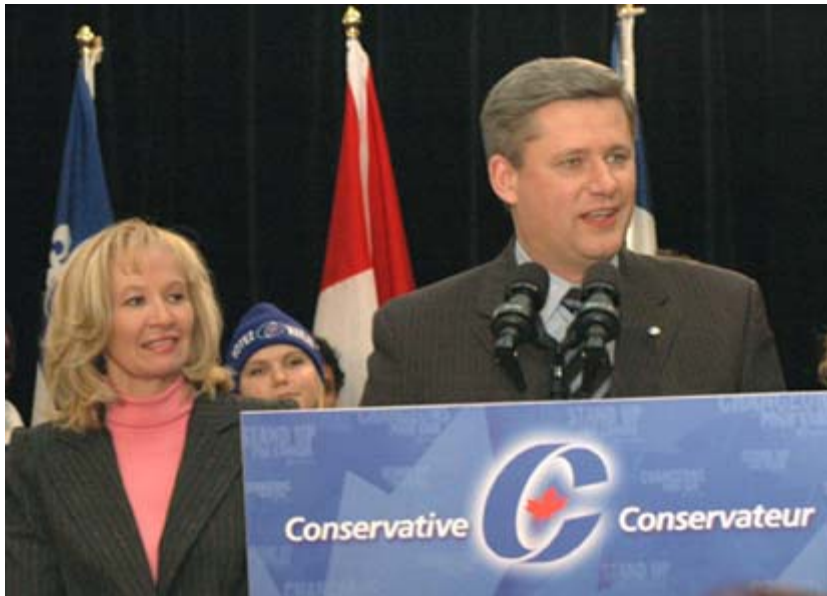
Laureen et Stephen Harper