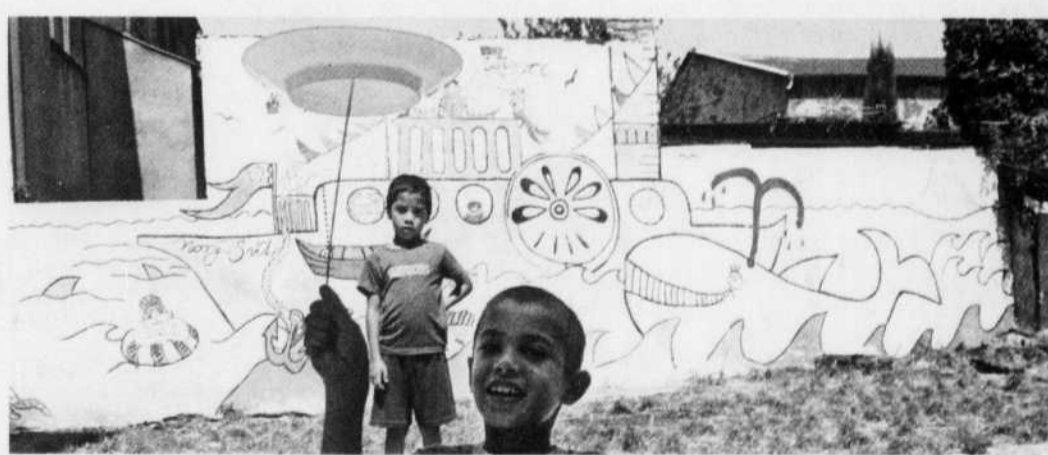
Deux jeunes Roms tchèques

Les autorités se bornent à dire qu'elles ont implanté des politiques sociales pour aider la minorité rom, mais celles-ci ne se sont pas traduites par un changement de mentalité concret sur le terrain. Les Roms continuent d'être victimes de discrimination au niveau institutionnel par les policiers, le personnel de santé et les enseignants. De plus, beaucoup d'enfants roms continuent d'être envoyés