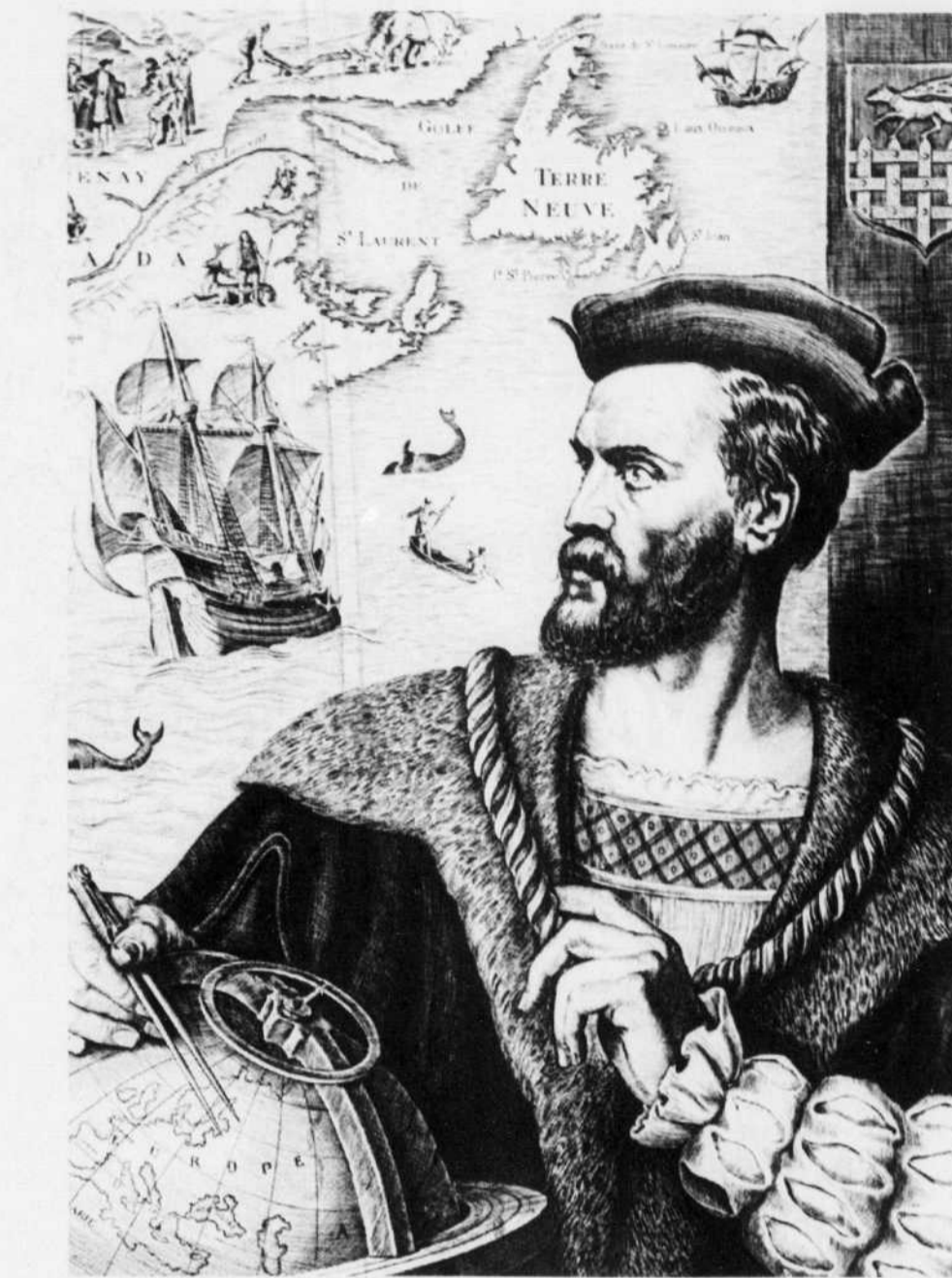
Jacques Cartier: explorateur plutôt que découvreur?

Explorateur plutôt que découvreur, ce Jacques Cartier? C'est mon avis. Du moins lors de son premier voyage. Lorsqu'il débarque en Gaspésie à l'été 1534, la péninsule est peuplée depuis au moins 8000 ans par des hommes et des femmes qui planteront, au fil des siècles, des sociétés structurées. Ces Amérindiens ont apprivoisé le territoire; ils fréquentent, habitent et nomment les lieux de cette vaste péninsule, de ce bout du monde appelé «Gespeg» dans leur langue. Cartier rencontre des centaines de Micmacs et d'Iroquois dans la baie des Chaleurs et dans la baie de Gaspé. Ces derniers semblent beaucoup moins effrayés que lui. Normal, puisque ces premiers Gaspésiens côtoient depuis un certain temps déjà des pêcheurs européens d'origines basque, bretonne et normande. Contrairement à Cartier, ces pêcheurs ne sont pas «commandités» pour remplir une mission. Ils naviguent discrètement dans nos eaux pour y prélever une ressource de plus en plus convoitée: la morue. Quant à Cartier, il a reçu un mandat officiel du roi de France, celui de «décou-