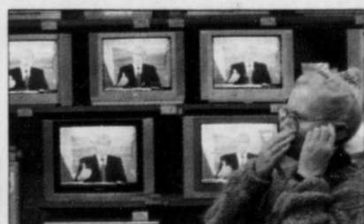
Pour les compagnies de câble, le nombre d'abonnés au service de base a décliné de 0,4 %.

Le satellite et l'hertzien font meilleure figure