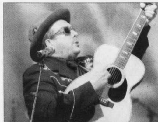
Elvis Costello a levé sa guitare en l'honneur de Paul Simon, mardi soir.