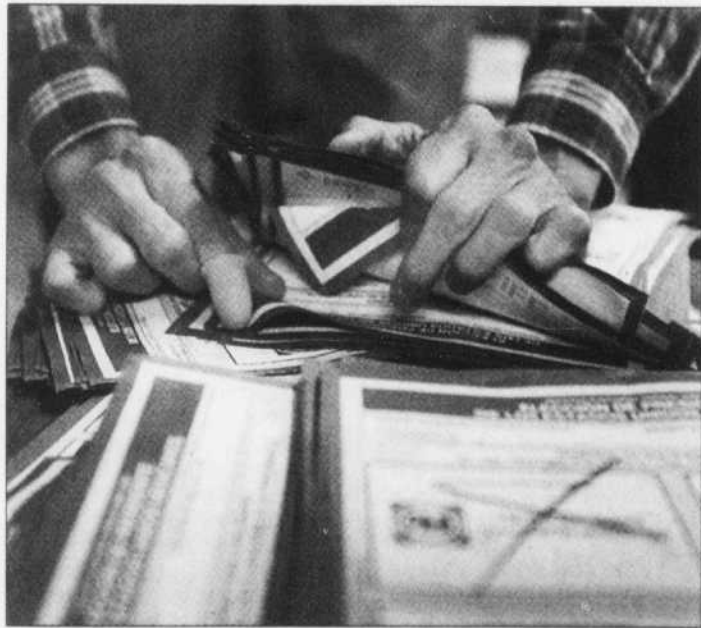
JORGE SILVA REUTERS