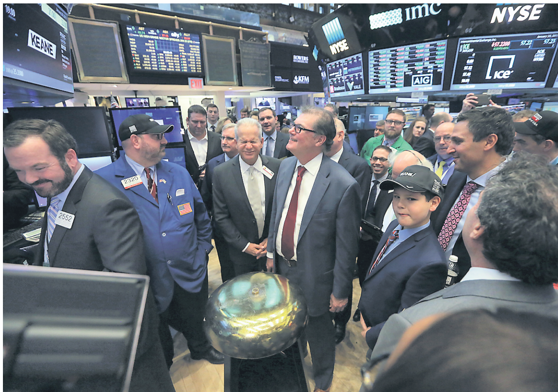
Plusieurs stratégies financières croient que l'effet Trump a déjà fait long feu à la Bourse. C'est ainsi que le Dow Jones se bute au seuil psychologique des 20 000 points depuis le tournant de l'année.

Selon les détracteurs, les « Trumponomics », mot-valise pour englober tout le programme économique du président en poste depuis hier, portent en germe des risques considérables qui pourraient