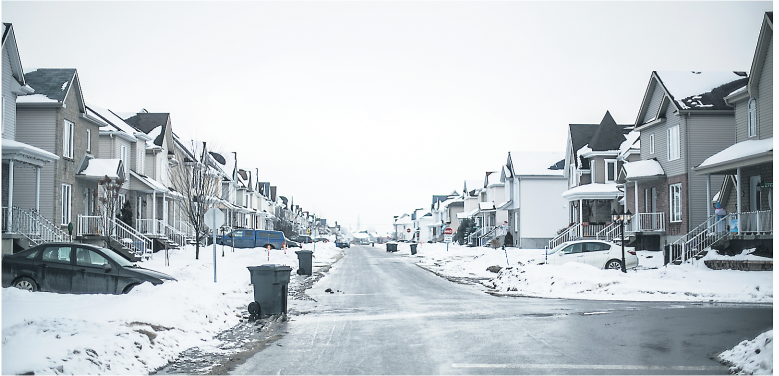
Saint-Lin – Laurentides (notre photo) a le plus fort taux d'insolvabilité par 1000 adultes au Québec chaque année depuis 2012. Sainte-Sophie et un secteur de Saint-Jérôme complètent le podium.

Quand on quitte la route 158 pour ses quartiers résidentiels, on traverse de paisibles défilés de bungalows, comme il en existe des centaines au Québec. Pas d'épidémie de pancartes de reprises de finance, mais des parcs et des voitures plus nombreuses, signatures des petites familles attirées par la propriété. Le marché immobilier est en ébullition, avec 238 maisons unifamiliales en vente à la mi-janvier, selon Centris.ca, un nombre bien supérieur à celui de municipalités de taille comparable.