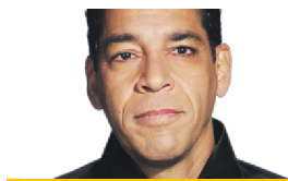
RICHARD HÉTU COLLABORATION SPÉCIALE

Dans les gradins du Prudential Center, ce cri un peu rageur est monté au début de la troisième période du match entre les Devils et le Canadien pour couvrir les voix des partisans de l'équipe montréalaise, qui se réjouissaient d'un but inscrit par Shea Weber procurant à son équipe une avance de 2-1.