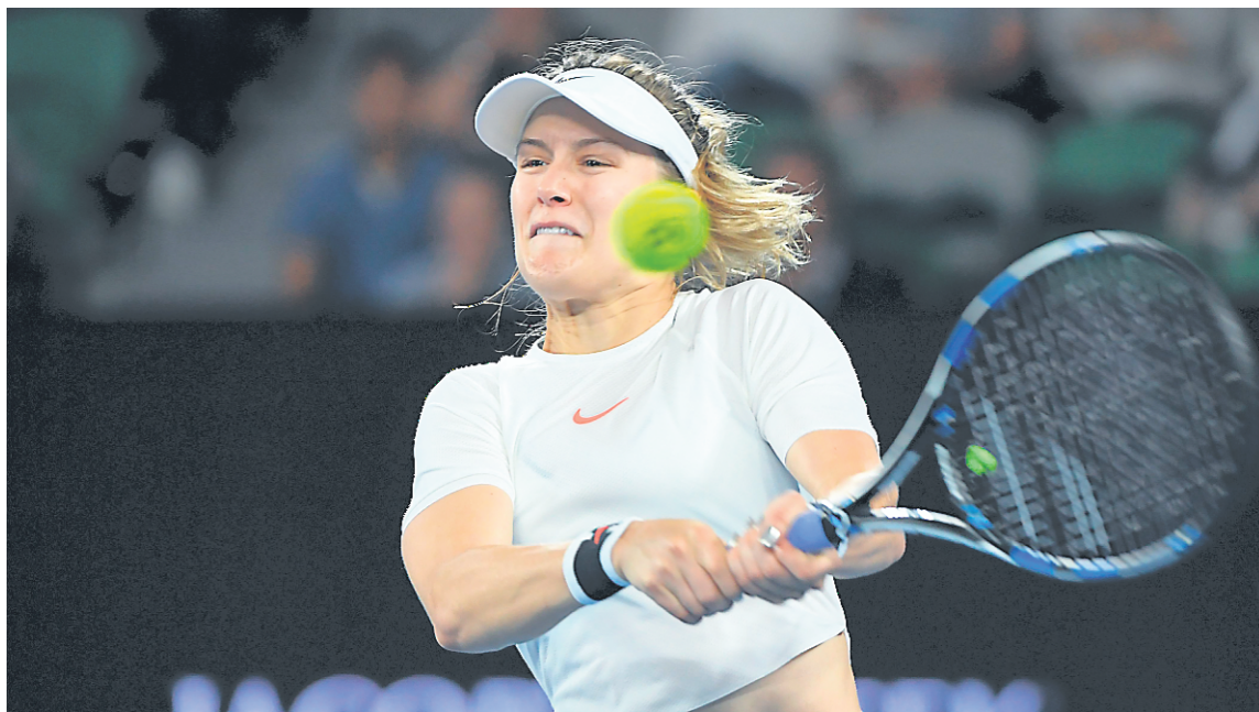
Sans être parfaite, Eugénie Bouchard a fait preuve d'une belle combativité tout au long de son match contre l'Américaine Coco Vandeweghe, ne «craquant» que dans les jeux ultimes.

Malgré sa nervosité, la 47 e mondiale a évolué à un bien meilleur niveau qu'au cours des derniers mois de la saison 2016. «Les deux dernières saisons ont été difficiles, particulièrement la deuxième partie de l'année dernière, a-t-elle concédé en point de presse. Cela fait un an que je n'ai plus l'habitude d'aller loin dans les tournois, de jouer plusieurs matchs en succession contre des joueuses