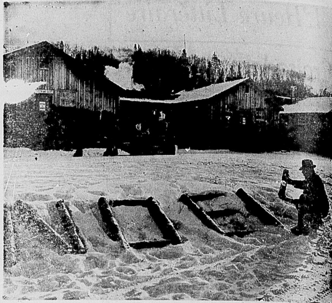
La température est à 20 degrés sous zéro au camp du bois de pulpe et le porteur d'eau fait sa ronde alors que le surintendant du camp inscrit "Joyeux Noël" avec des billes de dans la neige, pour préparer les grandes célébrations de Noël. Des millions de ces billes de pulpe de quatre pieds de longueur sortent de la forêt de la Gatineau chaque année; pour faire du papier-journal, des papiers fins, des plastiques, des planches murales et nombre d'autres produits.

miner les vibrations et les bruits ennuyeux de la route. Une autre caractéristique additionnelle se trouve dans les nouveaux isolants des montants de la carrosserie des modèles Chieftain et Star Chief; ils séparent la carrosserie du cadre au moyen d'un isolant de caoutchouc moulu. Cela, plus que le fait qu'on a changé la position des montants, contribue à faire des nouvelles Pontiac les plus silencieuses et les plus confortables jamais construites.