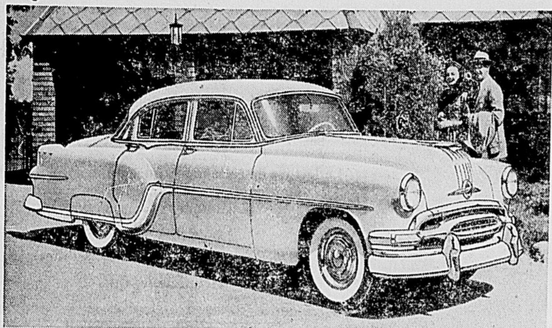
Avec l'introduction de la Star Chief 1954, illustrée ci-dessus, la Pontiac prend sa place à côté des voitures les plus grosses et les plus imposantes sur la route. Avec un empattement de 124 pouces et une longueur hors-tout de 213.7 pouces, la Star Chief a 11 pouces de plus que les plus longues des autres Pontiac 1954. Les Star Chief, Chieftain Deluxe, Chieftain Special, Laurentian, Pathfinder Deluxe et Pathfinder présentent un choix de 31 modèles différents, mais qui se reconnaissent immédiatement comme des Pontiac grâce à leur superbe nouveau style Silver Streak distinctif. De plus belle apparence que jamais, la Pontiac 1954 offre une valeur supérieure en fait de puissance, d'économie et de performance en général.