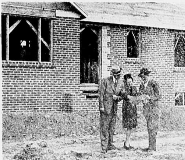
SOME DAY THIS DREAM HOUSE will take shape for a couple who have planned wisely for their future. Like thousands of other Canadians, they bought Victory Bonds during every Loan and accumulated a sizeable nest-egg. Buying Bonds during the 9th Victory Loan will help you, too, to build a "dream house" or buy any of the wonderful new products available in the future.