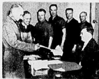
POPULAR PAYROLL SAVINGS PLAN will permit workers to spread payments on 9th Victory Loan Bonds over 12 months to enable them to buy double the amounts formerly purchased every six months. A large percentage of the workers shown here buying Bonds during the 8th Victory Loan will again buy one bond for cash and another on the wage-deduction plan.