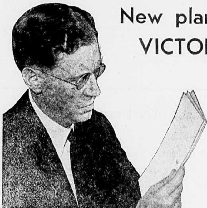
MINISTER OF FINANCE, Hon. J. L. Hilsley , in announcing October 22nd as the launching date for the new loan, said: "I believe the success of past Loans has been largely due to the public's appreciation of the investment value of Victory Bonds. By now nearly everyone knows that the whole resources of the Dominion are behind these bonds, that they are as good as cash and earn interest at the rate of 3%. I am fully confident that the 9th Victory Loan will be another complete success."

New plan now calls for only one VICTORY LOAN during 12-month period