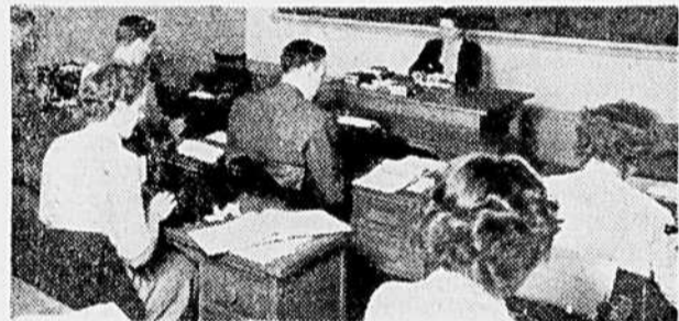
" RAT-A-TAT " of machine guns is replaced by that of typewriters in Canadian Vocational Training class for veterans. This group, taking business course provided under rehabilitation program, is typical of those receiving instruction to qualify them for employment in their chosen vocations. Your Victory Bonds will help pay for this valuable assistance to veterans.

The convenience of having only one Victory Loan during the next year is stressed and payments may be spread over the 12-month period. It is anticipated that the public will respond enthusiastically to the new plan and put the 9th Loan over the top.