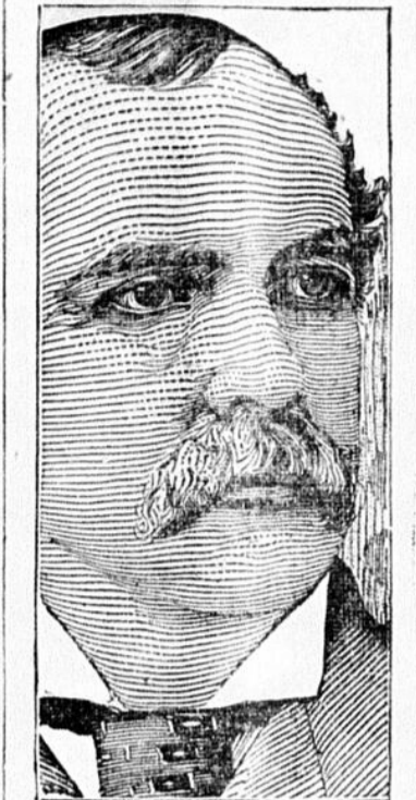
EX-SÉNATEUR M. C. BUTLER.

Le Dyspeptique est Souvent Guéri par le Catarrhe de l'Estomac et par conséquent est un Remède pour la Dyspepsie.