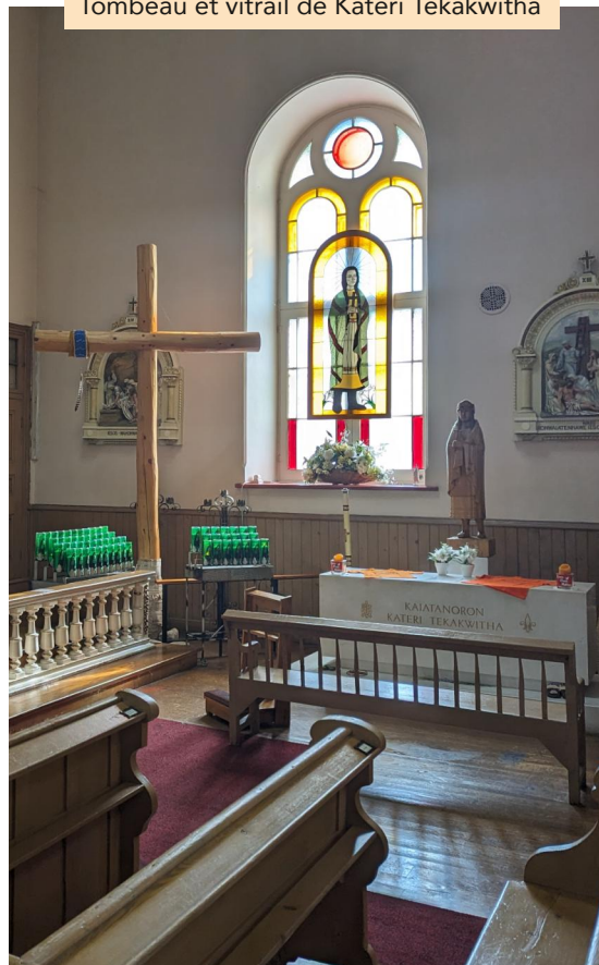
Tombeau et vitrail de Kateri Tekakwitha

Ça a été un long processus. J'en parle dans mon livre Sans réserve. Peu à peu, j'ai appris à déconstruire les stéréotypes d'« indigénité » projetés sur Kateri. Ils étaient les mêmes pour moi, et j'étais en train de les défaire moi aussi. J'ai laissé sa trajectoire spirituelle hybride parler d'elle-même. Kateri m'a appris que ce qui est sacré sur terre et dans la vie est encore plus vibrant lorsque nos pieds s'enracinent dans deux cultures. >