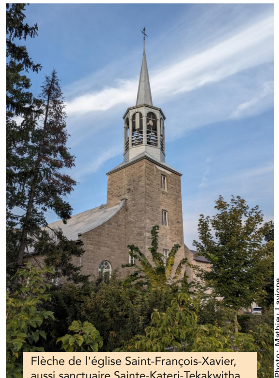
Flèche de l'église Saint-François-Xavier, aussi sanctuaire Sainte-Kateri-Tekakwitha, à Kahnawake.

Kateri rappelle aux peuples autochtones que tout ce territoire, la ville y compris, est « chez eux ». Et elle interpelle aussi le reste d'entre nous à apprendre à vivre « chez nous » comme nos frères et sœurs autochtones sont chez eux: dans une réciprocité avec la terre et avec toutes les personnes qui en font leur maison. ●