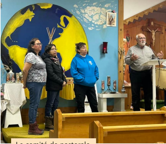
Le comité de pastorale

Mais que s'est-il passé concrètement le 2 novembre 2024 à Wemotaci ?