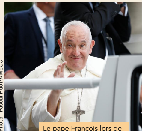
Le pape François lors de son passage au Canada en juillet 2022.

« Que la communauté chrétienne ne se laisse jamais contaminer par l'idée qu'il existe une supériorité d'une culture par rapport à une autre et qu'il soit légitime d'utiliser des moyens de coercition contre les autres. »