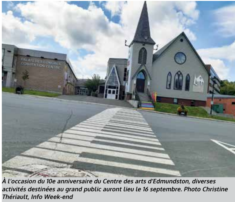
À l'occasion du 10e anniversaire du Centre des arts d'Edmundston, diverses activités destinées au grand public auront lieu le 16 septembre.