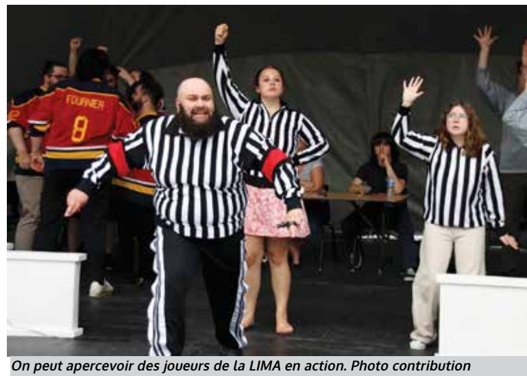
On peut apercevoir des joueurs de la LIMA en action.