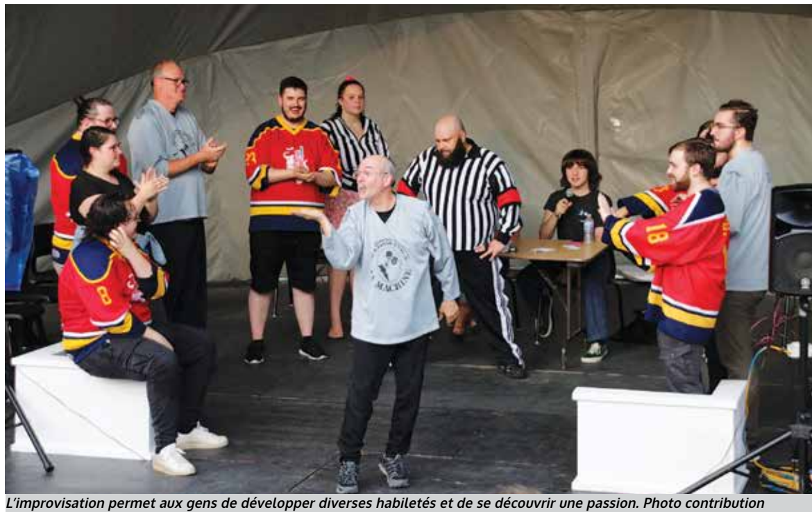
L'improvisation permet aux gens de développer diverses habiletés et de se découvrir une passion.

Ce dernier donne un aperçu du déroulement de ces soirées axées sur