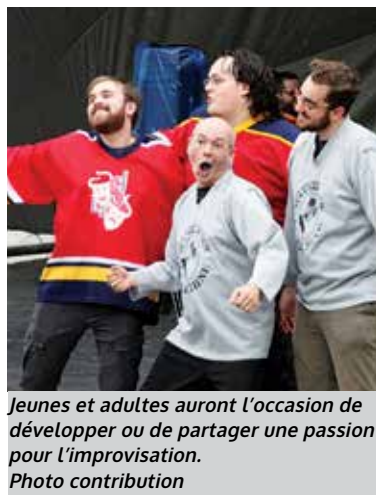
Jeunes et adultes auront l'occasion de développer ou de partager une passion pour l'improvisation.