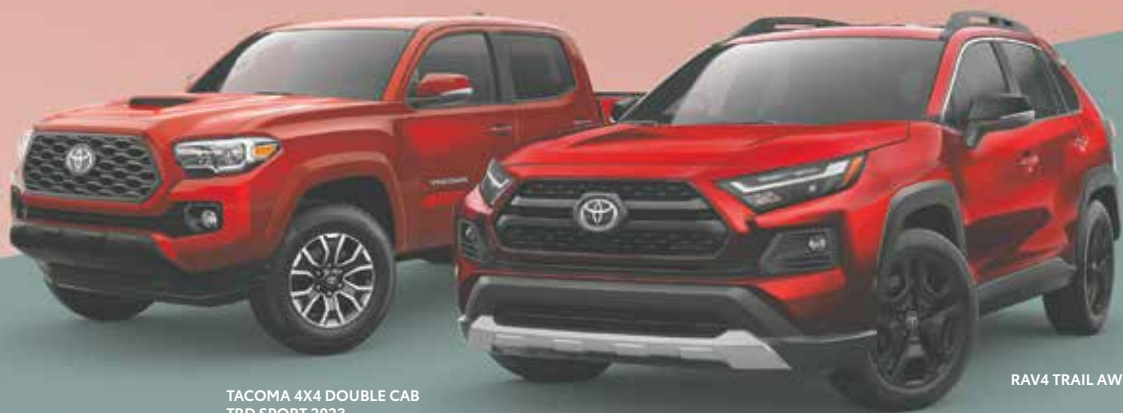
TACOMA 4X4 DOUBLE CAB TRD SPORT 2023