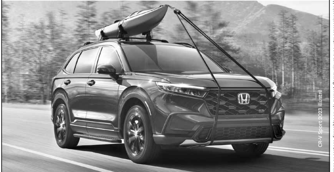
CR-V Sport 2023 illustré