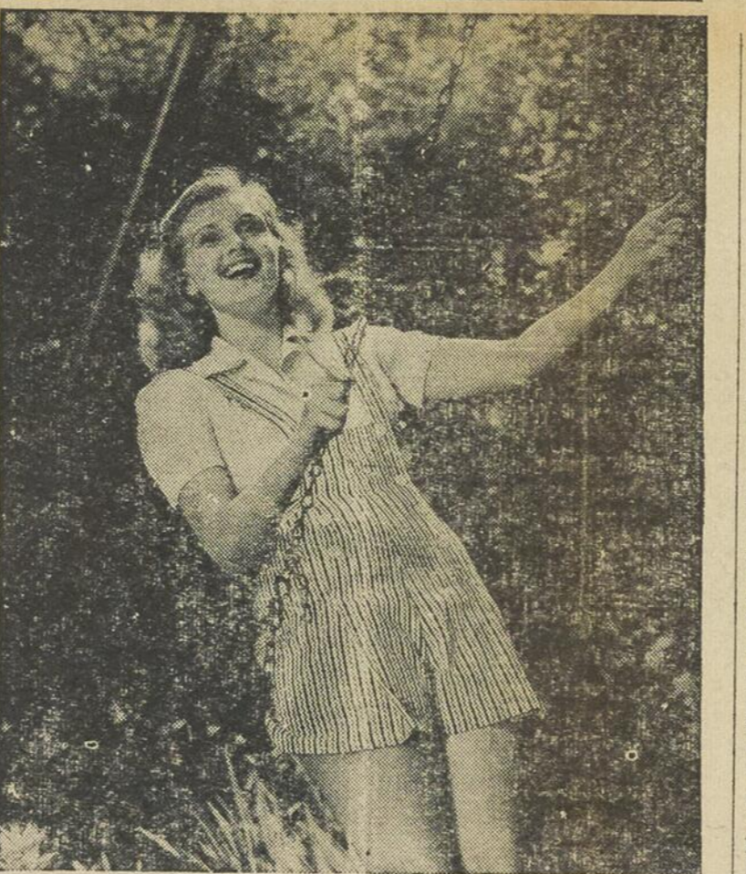
Lorsque l'éclairage vient d'en arrière comme dans cette photo, l'usage d'une lampe à éclair pour suppléer à la lumière extérieure contribue à adoucir les ombres sur le visage du sujet.