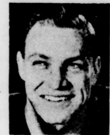
Bobby Hull 40 buts