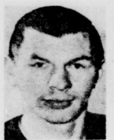
Stan Mikita Meilleur compteur