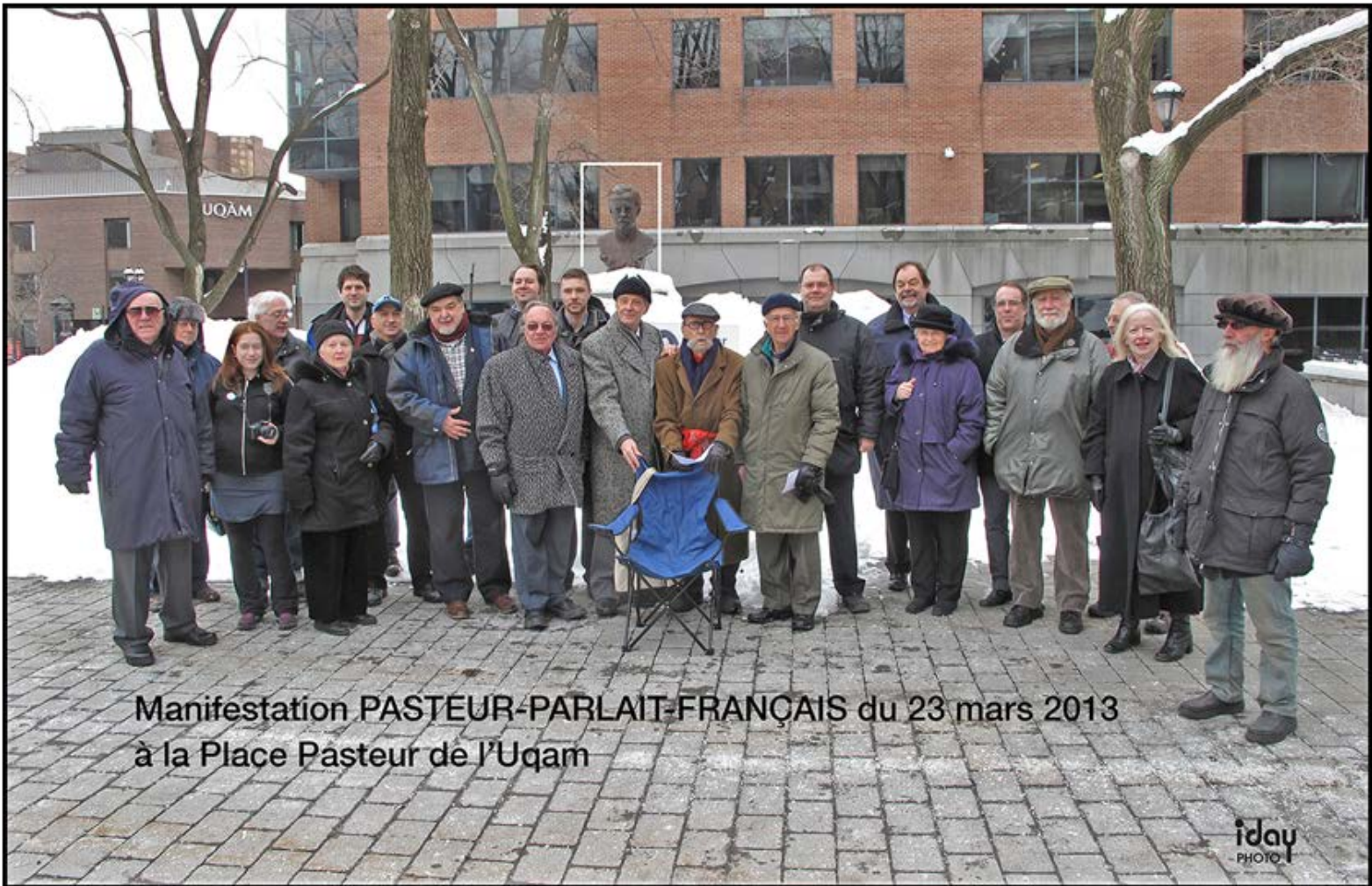
Fig. 4. PPF2013.IDay