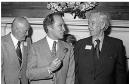
Fig. 1. Photo: Fred Chartrand Archives La Presse canadienne Photo: Fred Chartrand Archives La Presse canadienne Le premier ministre Trudeau, après son fameux discours devant le Congrès américain, le 22 février 1977.

3 janvier 2015 | Louis Massicotte - Professeur au Département de science politique de l'Université Laval | Canada