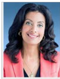
Fig. 1. Dominique Anglade. AN.