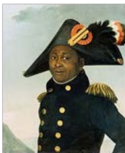
Fig. 2. Toussaint Louverture. L'indépendance d'Haïti en 1803. Wiki. .