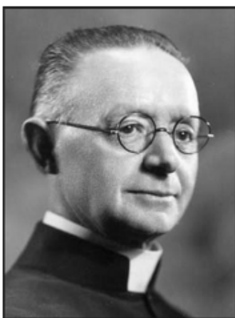
Fog. 1. Lionel Groulx.

Lionel Groulx, Le Devoir, 3 nov.1937. «Le terme indépendance fait trembler les esprits foncièrement colonisés. Que de pauvres gens émasculés de tout sens national, habitués à encaisser les affronts comme d'autres les récompenses, les coups de pied comme d'autres les caresses, se permettent de trouver ces griefs de peu d'importance, après tout, libre à eux, mais pour l'amour du ciel, qu'ils n'essaient pas d'imposer leur tempérament d'esclaves à ceux qui ont une autre notion de la liberté, de la dignité et de la fierté.»