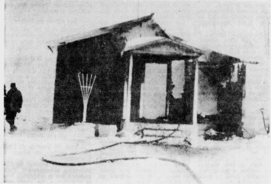
TRISTE NOEL — Une famille de St-Nicéphore a été durement éprouvée alors que la veille de Noël sa résidence et son mobilier entier ont été détruits par les flammes, tandis que le père blessé en voulant sauver ses deux enfants a dû prendre la route de l'hôpital. Sur cette photo, les pompiers de Drummondville tentent de maîtriser l'élément destructeur.

La mère et les deux enfants en bas âge avaient trouvé refuge chez un voisin.