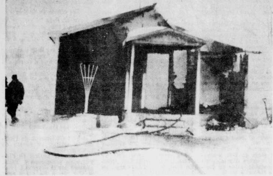
TRISTE NOEL — Une famille de St-Nicéphore a été durement éprouvée alors que la veille de Noël sa résidence et son mobilier entier ont été détruits par les flammes, tandis que le père blessé en voulant sauver ses deux enfants a dû prendre la route de l'hôpital. Sur cette photo, les pompiers de Drummondville tentent de maîtriser l'élément destructeur.