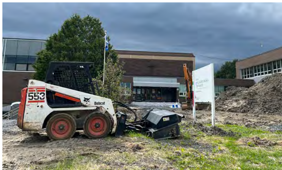
Des travaux étaient en cours, cet automne, sur le terrain de l'école Jacques-Rocheleau.