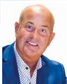
Philippe Clair Éditeur

Nous vous remercions pour votre soutien indéfectible au cours de l'année écoulée. Sans vous, notre journal imprimé et notre site Web n'existeraient tout simplement pas; c'est grâce à votre appui que nous sommes en mesure de vous livrer au quotidien les nouvelles locales qui vous concernent et vous intéressent.