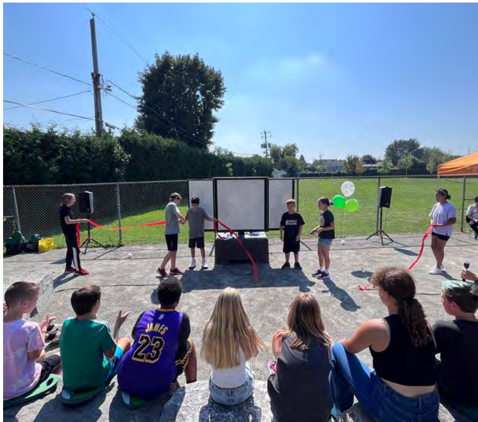
La classe extérieure de l'école de la Chanterelle a été inaugurée en septembre 2023.

Au bout du fil, on ressent la joie dans la voix de la directrice. « Nous avons monté le projet en consultant notre conseil d'établissement, nos enseignants. Maintenant que c'est accepté, nous allons nous rasseoir et consulter notre monde pour voir nos options », poursuit-elle.