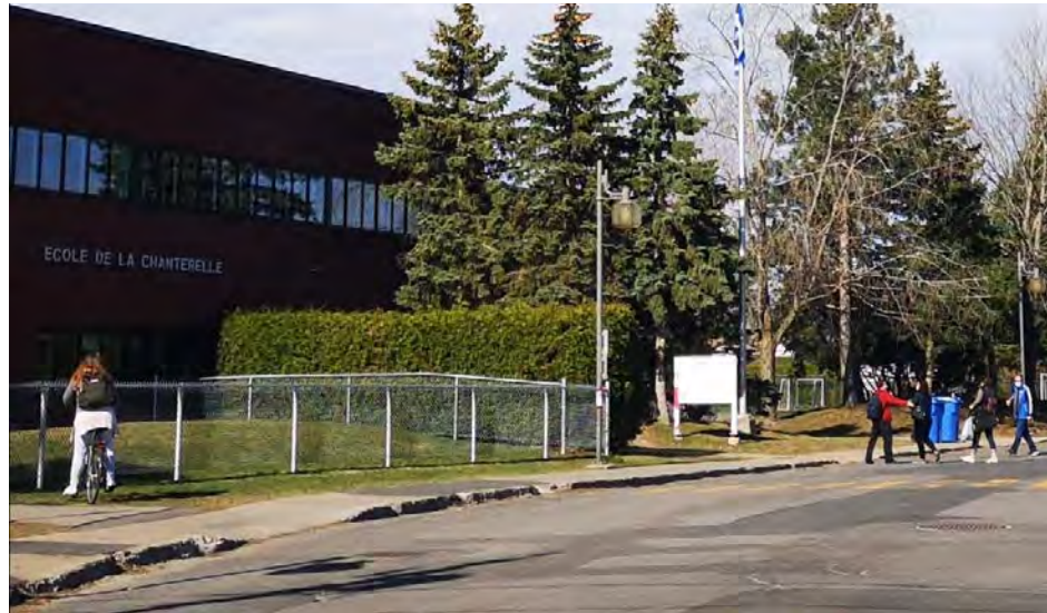
Le conseil municipal de la Ville de Saint-Basile-le-Grand a déposé le plan de déplacements scolaires.

Marie-Pier Ouellet mpouellet@versants.com