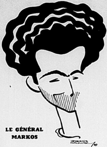
LE GÉNÉRAL MARKOS