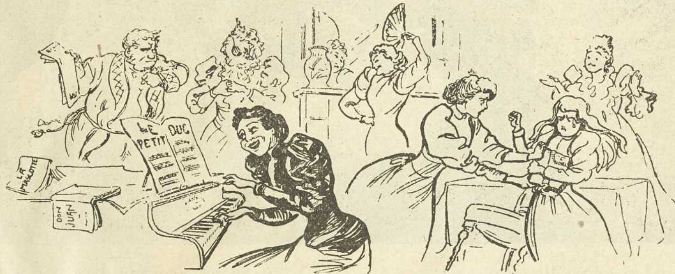
On s'amuseait ferme dans le salon des Jarnigoines quand on annonça la visite inattendue du nouveau curé.