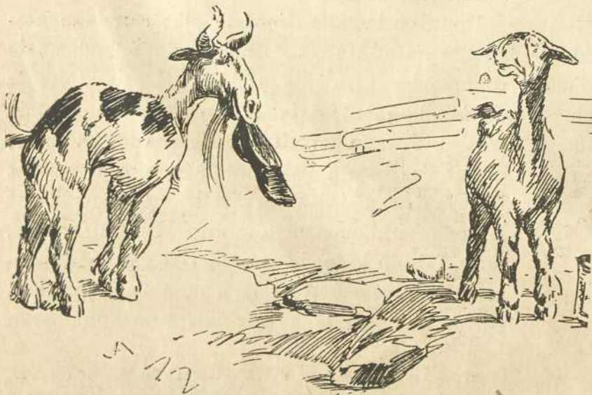
Le bouc. — Veux-tu une bouchée de cette galoche ? La chèvre. — Merci ; je ne mâche jamais de gomme.