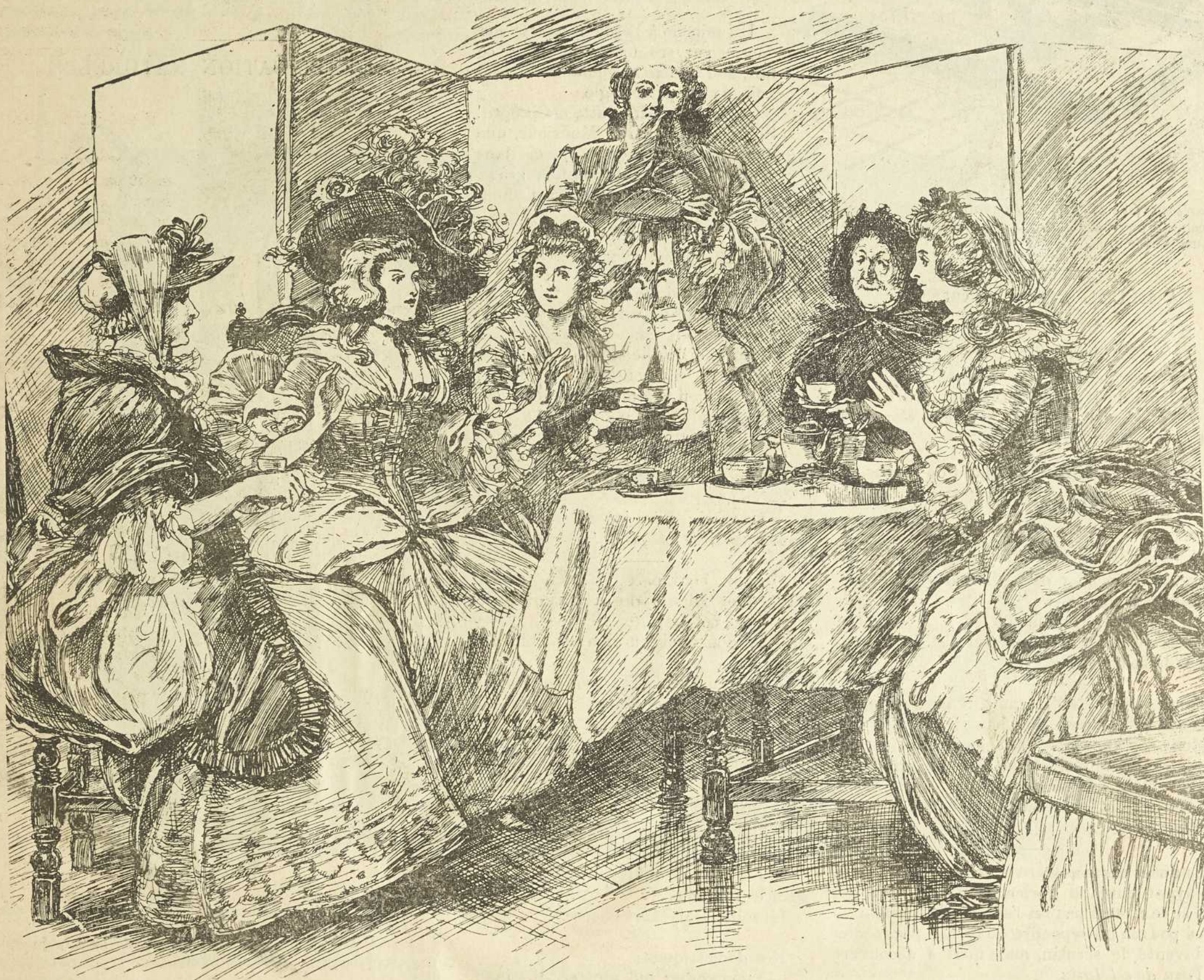
LE DERNIER SCANDALE.

Et elle s'offrit un canon Krupp, un vrai, portant à 18 kilomètres.