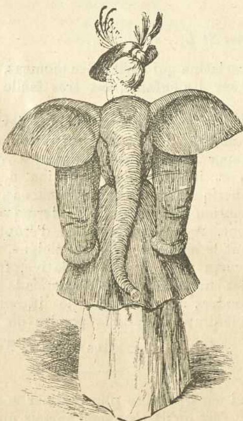
Les dernières modes.