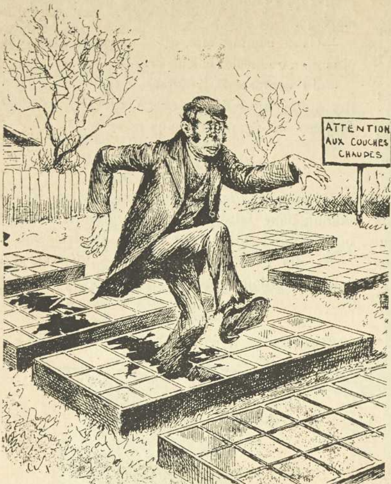
Garlebeu (à trois heures du matin). — Je n'avais pas d'idée qu'il pouvait se faire une croûte de neige si épaisse en quelques heures.