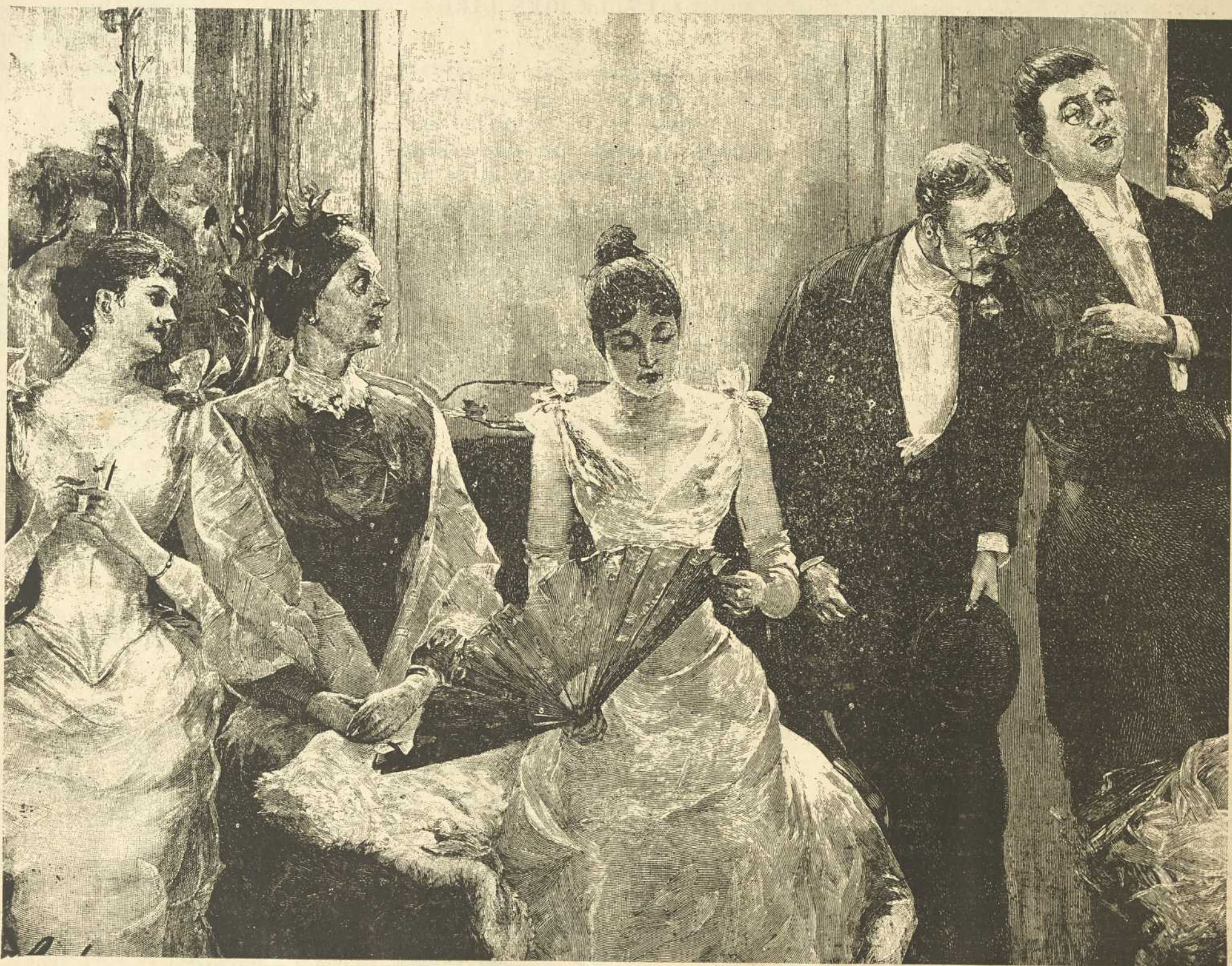
SUJET DE TAPISSERIE.

—Ne raillez pas cela, murmura-t-il d'une voix grave. Voulez-vous me permettre une histoire ?