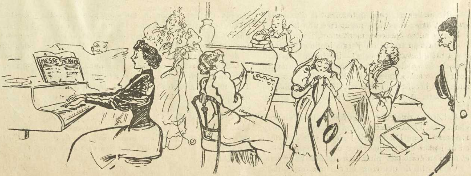
Et quand le vénérable visiteur entra dans l'appartement le changement de décors avait été si magique que madame Jarnigoine put lui dire avec candeur : — Oh ! monsieur le curé, vous nous surprenez tout à fait en famille !

Pâque ne peut tomber au plus tôt que le 22 mars ; ce qui arrive quand la pleine lune, qui fixe la fête, survient le 21 mars et que ce jour est un samedi. La réunion de ces deux circonstances est extrêmement rare ; elle a eu lieu en 1693, 1716, 1818, et se renouvellera en 1970, 2076 et 2144.