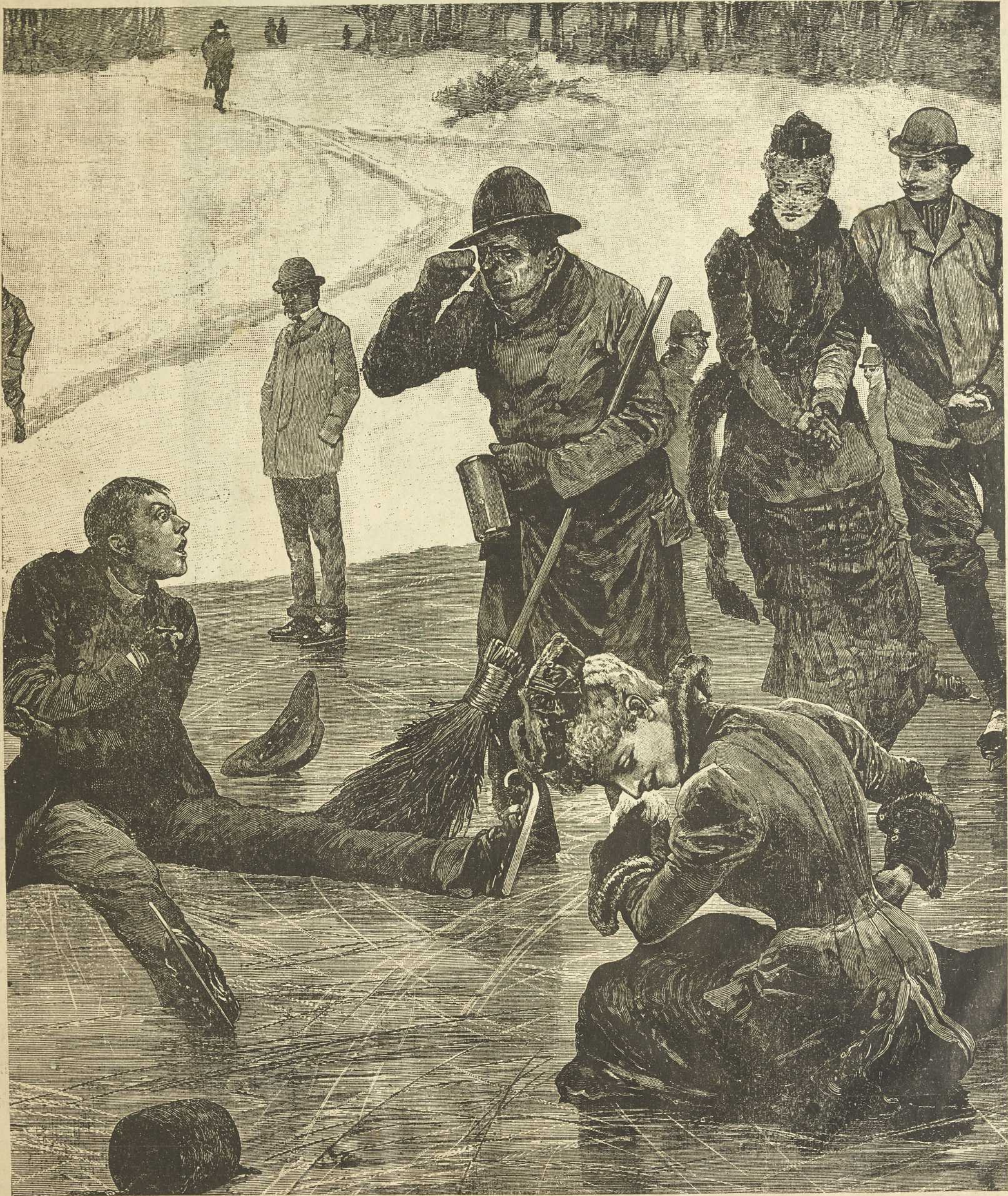
LES EXTRÊMES SE TOUCHENT.