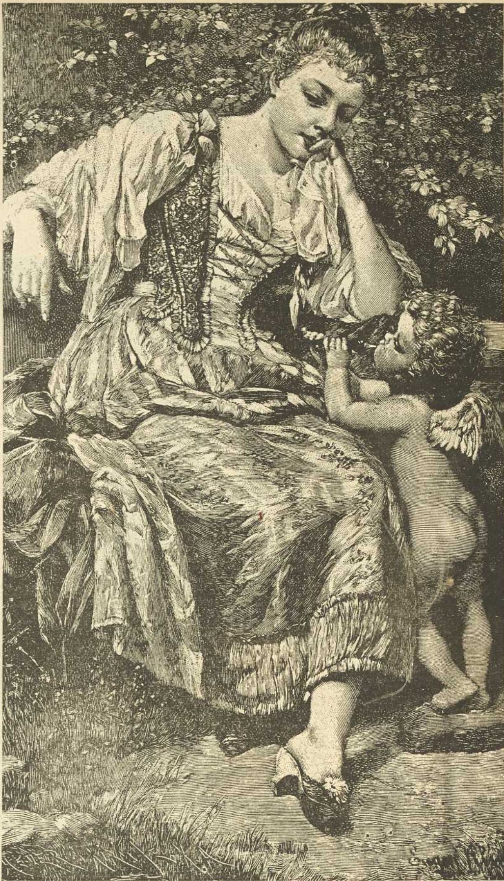
En conciliabule avec son Premier Ministre.