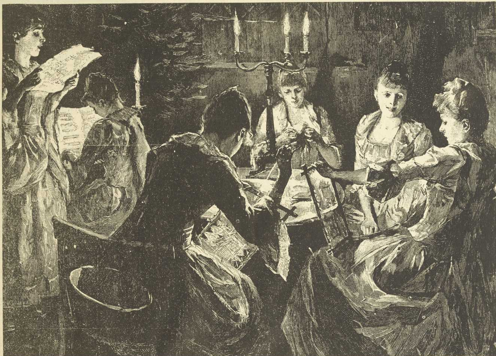
Elise —Vrai ! Tu crois à cette théorie du droit des femmes ? Tu prétends que chaque femme doit avoir un vote ? Hélène.—Non ; pas un vote ; mais un votant.

Si vous avez de vieilles dentelles que vous ne sachiez à quoi employer, je vais vous indiquer le moyen de vous confectionner un petit boa très coquet. C'est avec ces mêmes nœuds, mais en moire noire ou en surah de couleur claire ; on en garnit les bouts des vieilles dentelles en question qui trouvent ici un emploi du meilleur goût ; la guipure fait très bien aussi dans le bas, mais la dentelle est plus fine et plus riche.