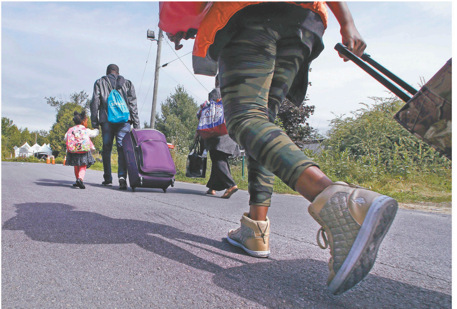
Une partie des migrants irréguliers pourront éviter de séjourner dans un centre de détention en attendant qu'on statue sur leur sort.

« Le fait qu'aucune des agences pertinentes ne relève de vous porte à croire que votre nomination était davantage un énoncé politique qu'une décision menée pour des raisons pratiques », lui a lancé le conservateur Pierre Poilievre.