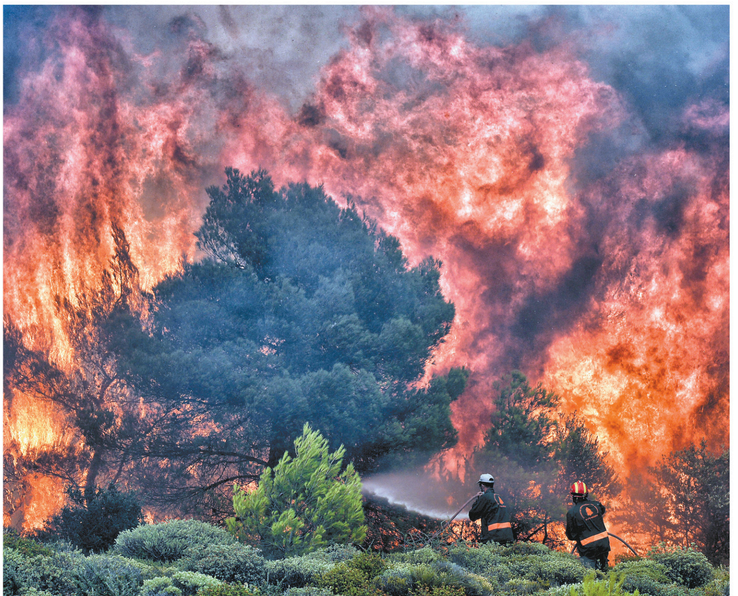
Des pompiers tentaient mardi d'éteindre un feu de forêt près du village de Kineta, près d'Athènes, en Grèce.