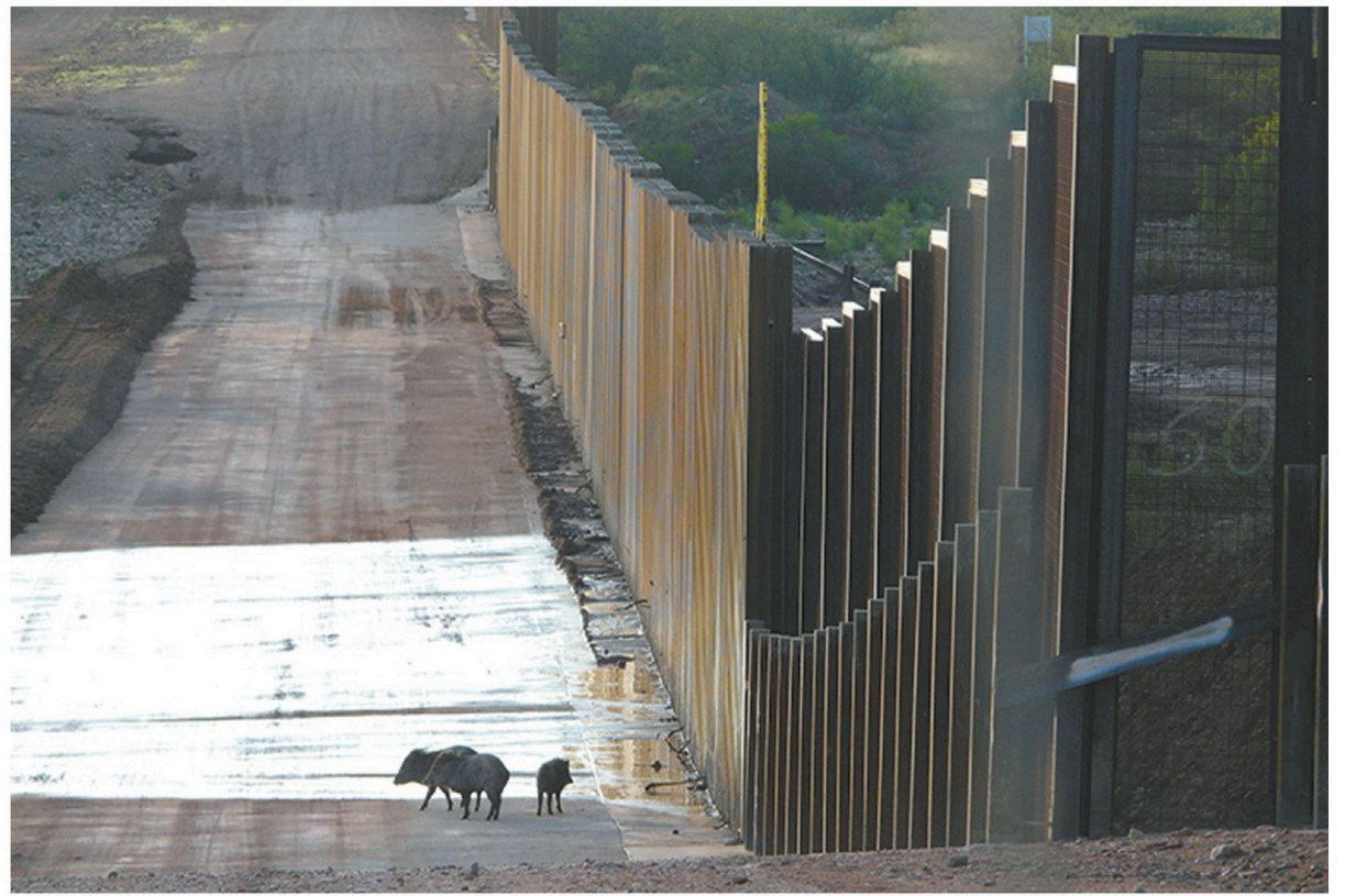
Le mur constitue aussi une barrière pour les espèces animales.