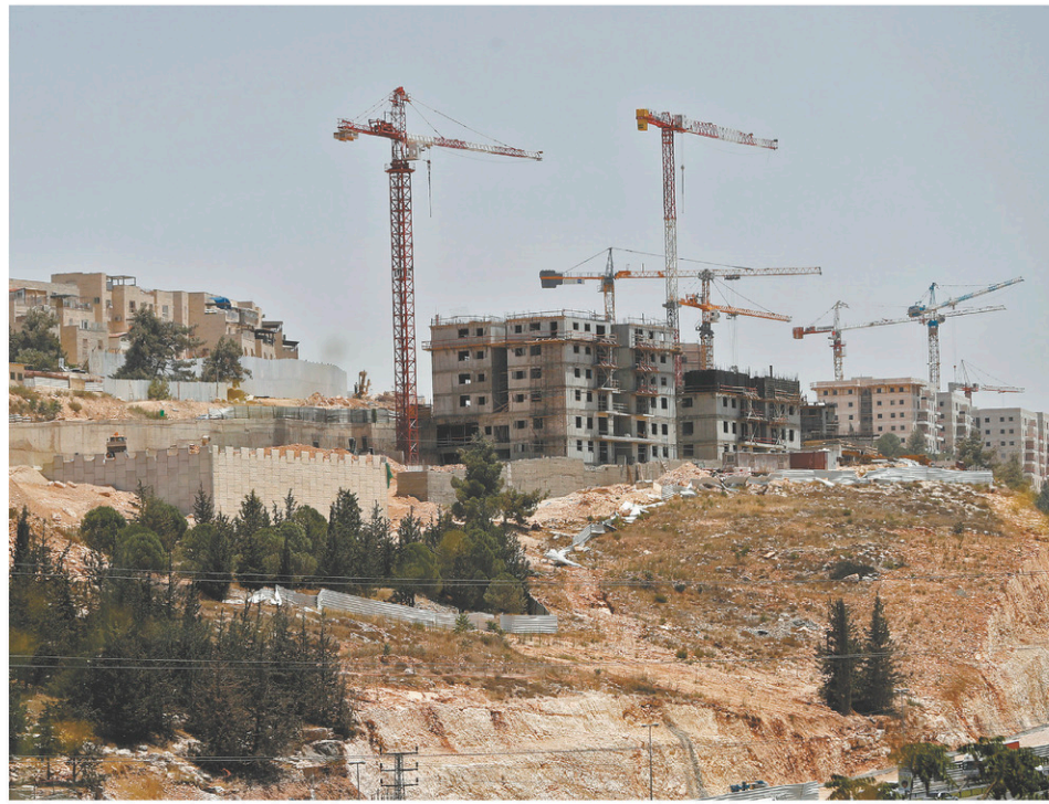
Chantier dans la colonie juive de Ramat Shlomo. La colonisation des territoires annexés n'a pratiquement jamais cessé, malgré les accords d'Oslo.

Une autre analogie sur l'inexorabilité de la colonisation: les « guerres indiennes » ont pris fin lorsque les colons européens sont parvenus à l'océan Pa-