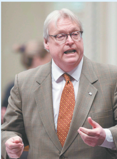
Gaétan Barrette