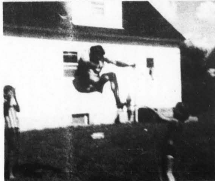
C'est qui? professeur de Thurso.