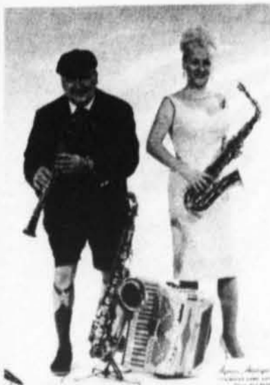
Danse avec orchestre "LES TSARS"

Danse: vendredi, samedi, dimanche - Spectacle: samedi et dimanche.