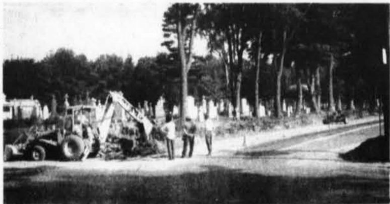
ROUTE 8 - 57

Lundi le 23 août, au Pavillon du Club Granit de Montebello, aura lieu l'assemblée annuelle générale des membres actionnaires de ce club. Tous les membres sont priés d'y assister.