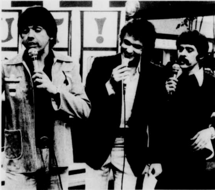
Boubou et les Coqueluches

Si vous voulez revivre les derniers instants de Boubou et si vous voulez avoir une idée de la nouvelle série qui prendra l'affiche à sa place en septembre, regardez Boubou , le mercredi 3 juillet à 20 heures. Vous ferez un retour dans un passé encore tout vibrant de souvenirs heureux et vous aurez la joie de découvrir une nouvelle émission.