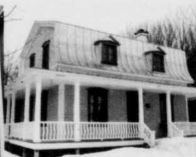
665, St-Alexis St-Louis-de-France