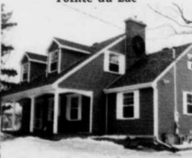
650, Notre-Dame Pointe-du-Lac