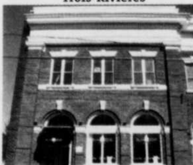
1066, Champflour Trois-Rivières