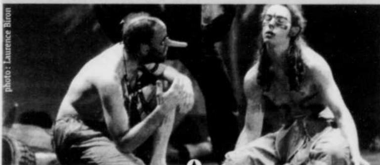
La pièce multidisciplinaire Légende, une œuvre fantastique d'une durée d'une heure quinze. Sans mot, sans parole, a été primée par les membres du jury.

En 2003, La P'tite semaine culturelle sera sous la responsabilité du Musée québécois de culture populaire.