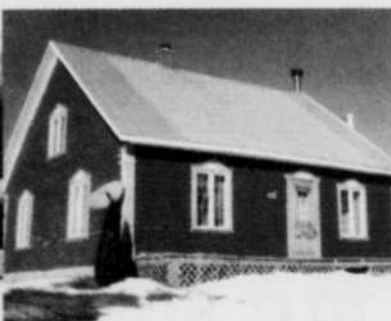
3951, de l'Acadie Pointe-du-Lac