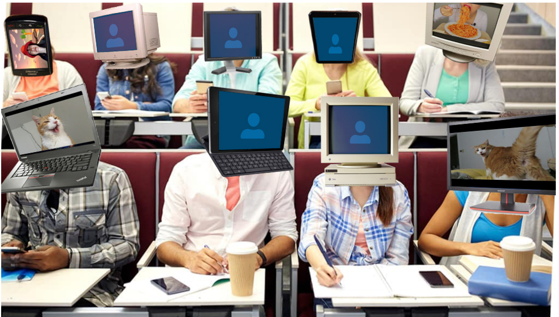
Illustration par Félix Beaudry (Instagram : @felix_beaudry_designer)

Sachant qu'il y a une pluralité de types d'apprenants, l'uniformité n'est pas envisageable, ni même souhaitable. La diversité des approches favorise l'apprentissage.