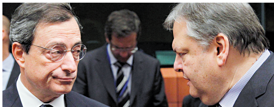
Le président de la Banque centrale européenne, Mario Draghi, en compagnie du ministre grec des Finances, Evángelos Vénizélos

«Il est essentiel que le nouveau gouvernement prenne des engagements clairs, par écrit, envers le programme UE-FMI et l'ensemble des éléments inclus dans le second plan [d'aide]», a déclaré le