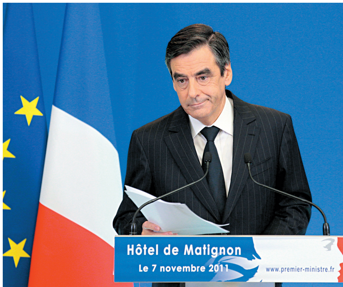
JACQUES DEMARTHON AGENCE FRANCE-PRESSE

Agence France-Presse et Associated press