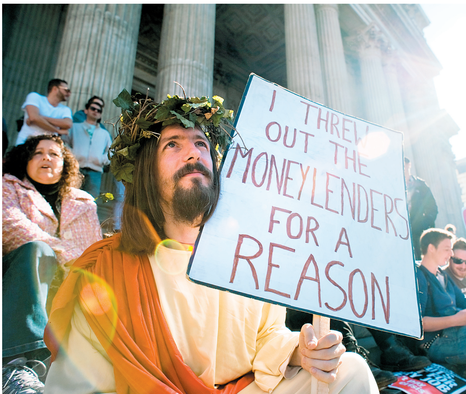
Les indignés qui campent devant la cathédrale Saint-Paul, à Londres, trouveront-ils un quelconque réconfort à la lecture d'une enquête qui démontre l'inquiétude des employés de la City devant les inégalités sociales?