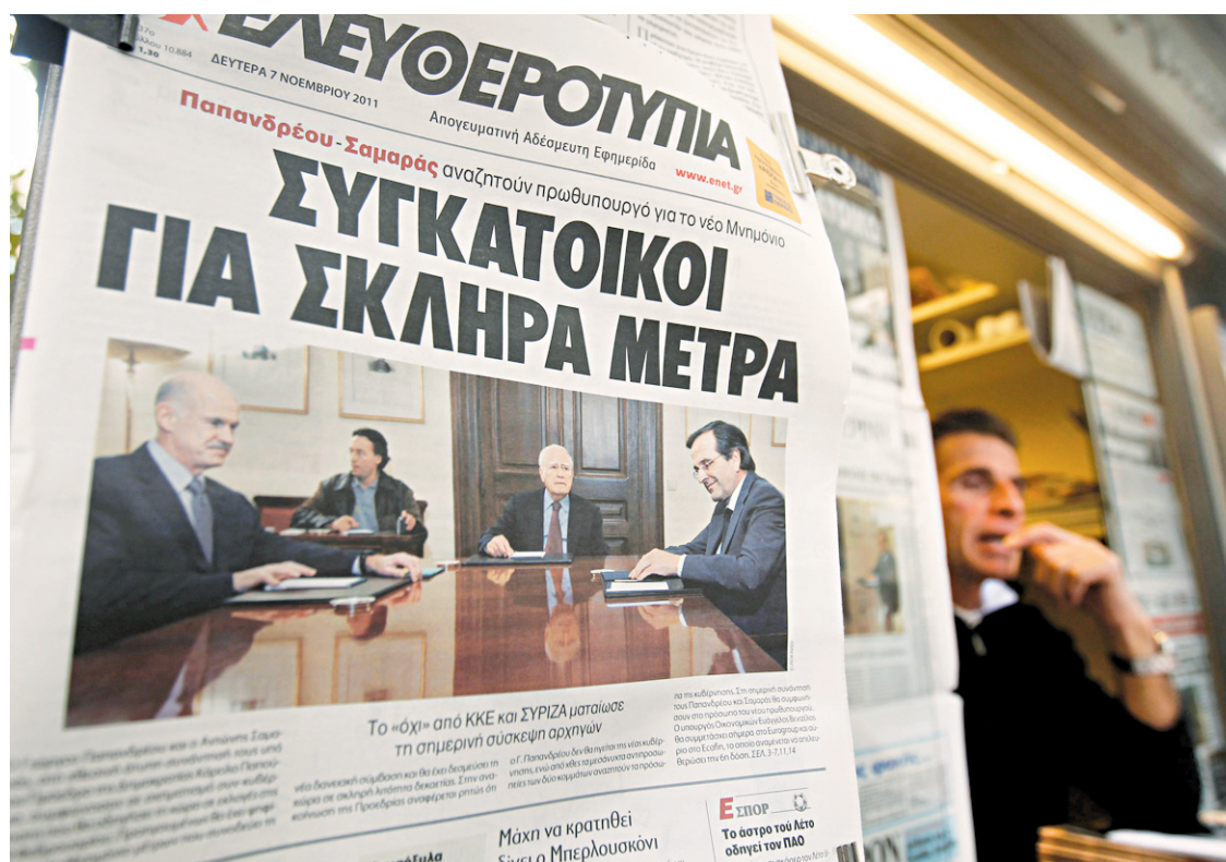
Les tribulations politiques occupaient toute la place hier dans les quotidiens grecs.

Le nouveau premier ministre aura la lourde tâche de mettre en œuvre l'accord signé à Bruxelles le 26 octobre qui conditionne le sauvetage de la Grèce à de nouvelles mesures