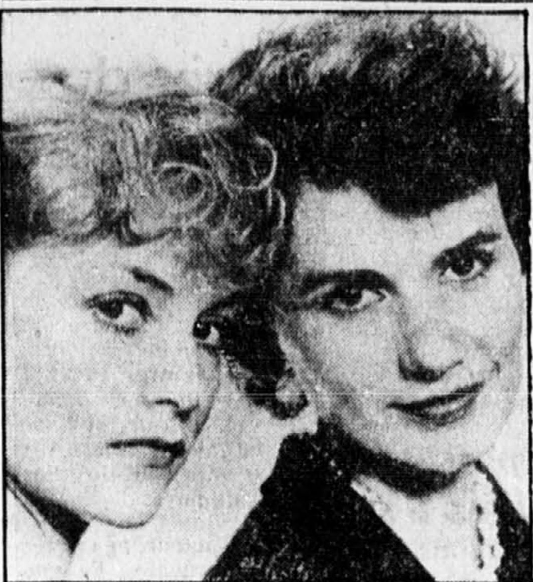
Isabelle Huppert et Miou-Miou dans Coup de foudre .