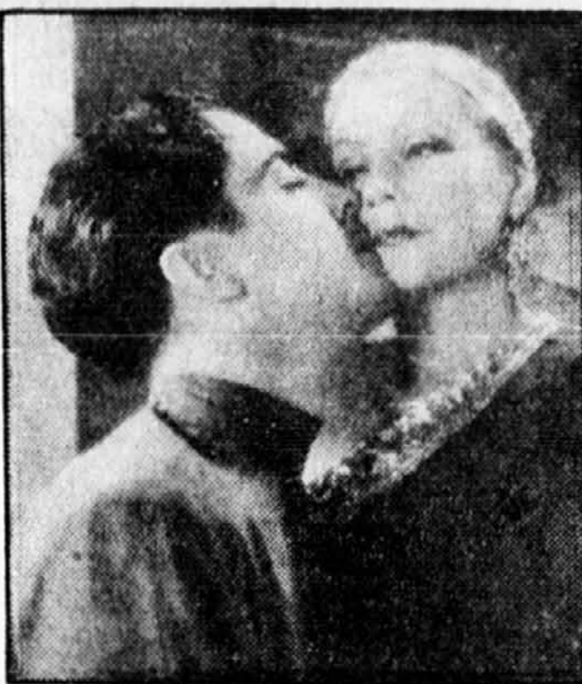
Greta Garbo et Ramon Navarro dans Mata Hari

L'industrie du film, avant la sortie de ce long métrage, s'est longtemps demandée comment un quelconque studio, même celui pour lequel Miss Garbo travailla durant toute sa carrière à Hollywood, pourrait person-