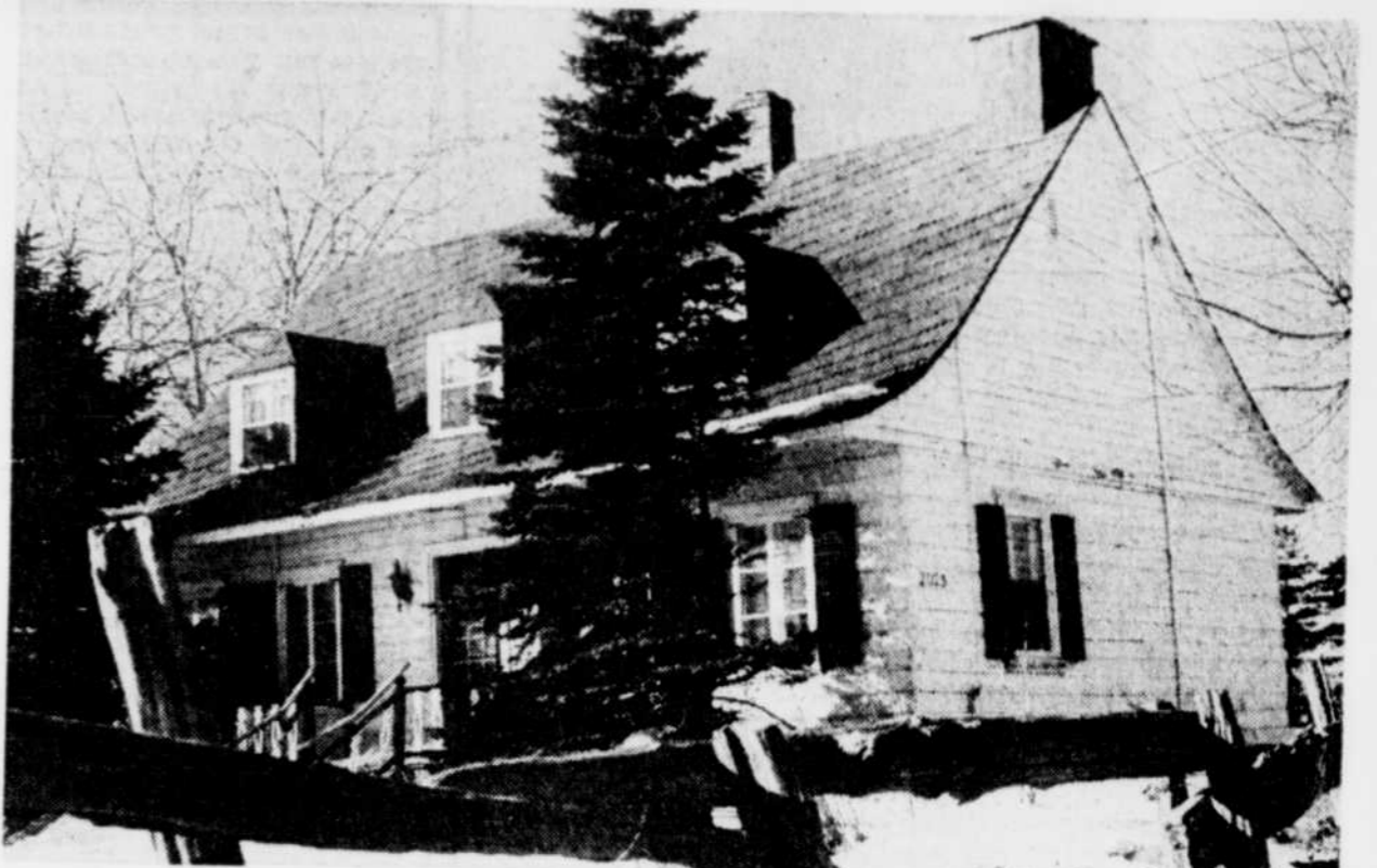
La maison Migneault, à Charlesbourg, a été au centre de l'actualité au cours des dernières semaines.

Le maire avance aussi l'éventualité d'offrir un abattement fiscal sur la plus-value d'une propriété à la suite de travaux. Par ailleurs, il souhaite la mise sur pied, par le gouvernement, d'un programme d'aide particulier afin de soulager les propriétaires aux prises avec toutes sortes de contraintes.