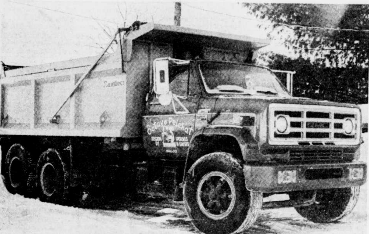
Le camion avec lequel Octave Pelchat fait ses maigres revenus.