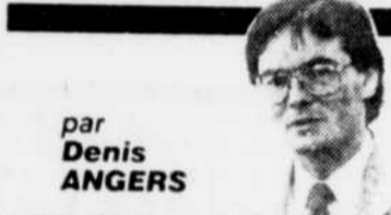
par Denis ANGERS

Dans le Québec des années 1960, on fermait des paroisses entières prétextant que leur avenir était bouché, que leurs ressources économiques étaient insuffisantes, que leur population déclinante ne justifiait plus le maintien de services pourtant essentiels. Un quart de siècle plus tard, on pourrait croire que les mêmes raisons seront bientôt invoquées pour justifier la fermeture, non plus de petites paroisses rurales, mais de régions entières. Car, en matière de développement régional, non seulement le Québec n'avance-t-il plus mais, par moments, il semble reculer à grandes enjambées.