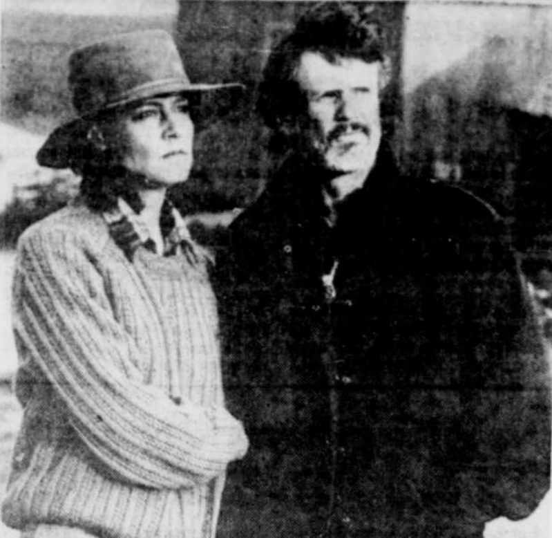
Christine Lahti et Kris Kristofferson, deux interprètes de "Amerika", série d'une durée de 14 heures et demie qui a perdu plusieurs téléspectateurs en cours de diffusion.