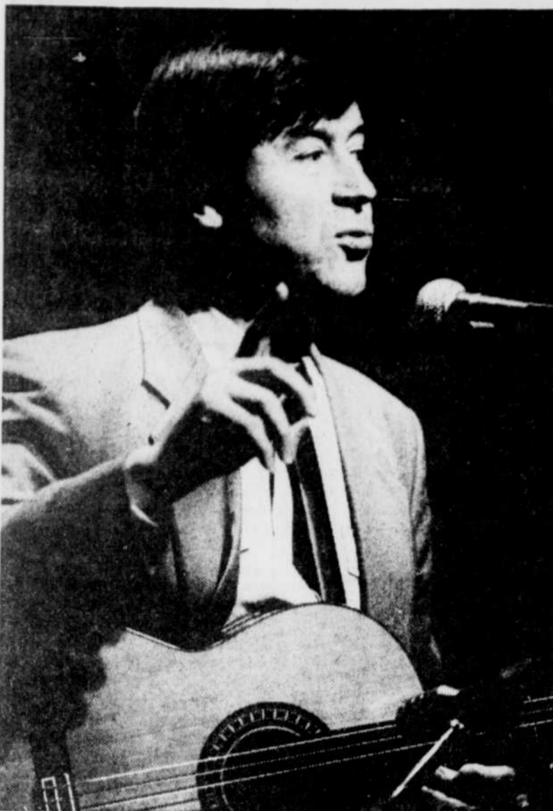
Le Soleil, Raynald Lavoye

Le programme de Jacques Bertin reposait sur des textes charnus dont plusieurs méconnus exigeant une constante attention de la part du public.