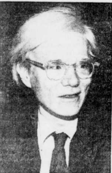
À la fois peintre, cinéaste, photographe, journaliste et homme d'affaires, Andy Warhol avait su faire de la provocation une oeuvre d'art.