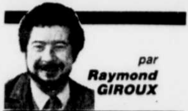
par Raymond GIROUX

Comme il est de bon ton dans les enceintes économico-politiques internationales, les plus grandes crises apparentes débouchent sur des compromis qui donnent l'impression que tout va subitement sur des roulettes, ou presque. Les accords officiels n'ont rien à voir avec l'ampleur des problèmes qui les sous-tendent.