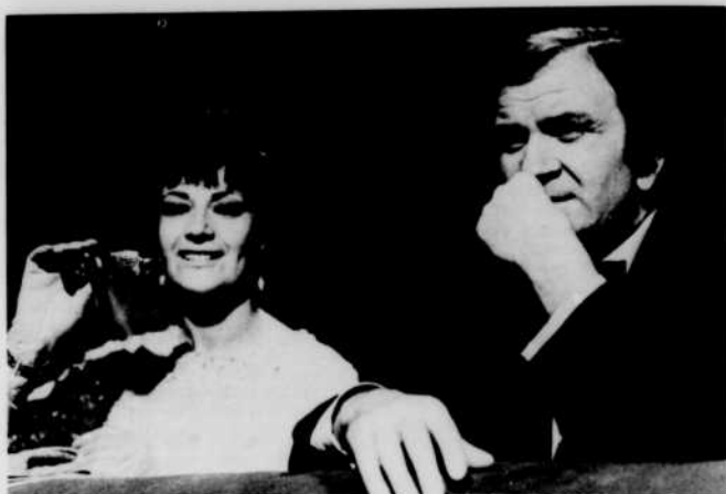
Les sympathiques comédiens Rosy Varte et Pierre Mondy dans les rôles de monsieur et madame Vaindrier, les parents de Noële.