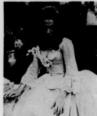
Le soprano canadien Teresa Stratas sera l'une des vedettes de l'opéra «La Rondine» de Puccini, présenté aux «Beaux Dimanches» cette semaine.