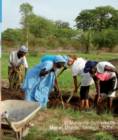
© Marianne Guillemette Mer et Monde, Sénégal, 2006.