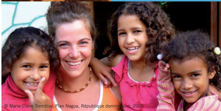
© Marie-Claire Tremblay, Plan Nagua, République dominicaine, 2005.

Chaque année, 400 jeunes Québécoises et Québécois réalisent des stages grâce au programme Québec sans frontières dans les pays en développement.