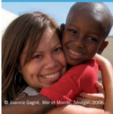
© Joannie Gagné, Mer et Monde, Sénégal, 2006.

Le ministère des Relations internationales du Québec consacre 14 % de son budget de solidarité internationale à la sensibilisation de la population québécoise.