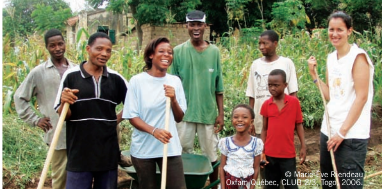
© Marie-Eve Riendeau Oxfam, Québec, CLUB 2/3, Togo, 2006.