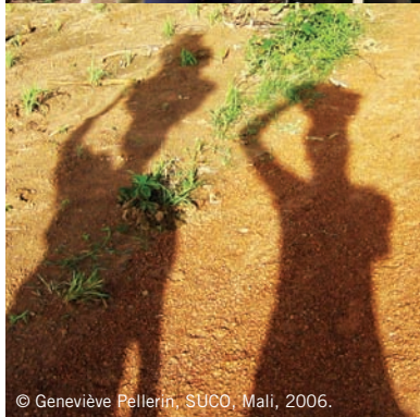
© Geneviève Pellerin, SUCO, Mali, 2006.