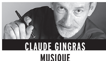
CLAUDE GINGRAS MUSIQUE

Cette saison encore, chacun des huit programmes de la série « Gala » de l'Orchestre Symphonique de Montréal est consacré à un compositeur et, cette semaine, c'est Robert Schumann qu'on célèbre.