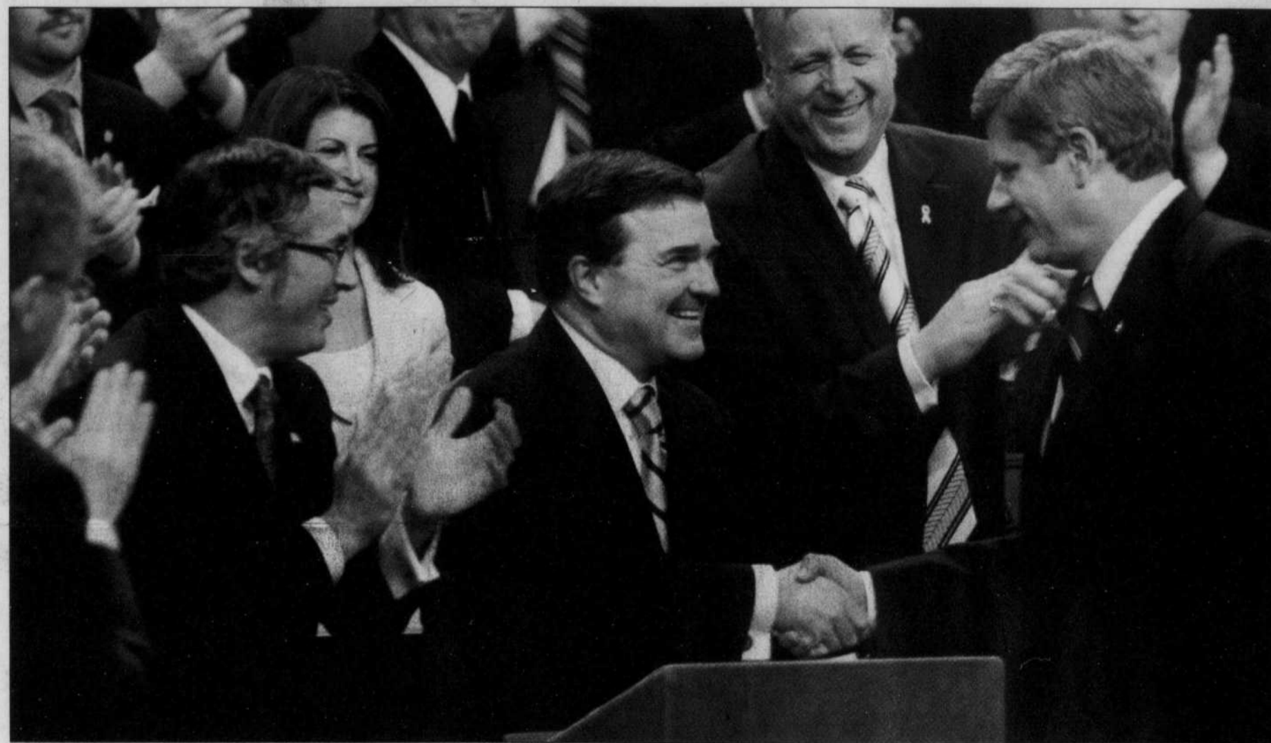
Le premier ministre Stephen Harper félicite le ministre des Finances, Jim Flaherty, après la lecture du budget, hier, à Ottawa.

Sur le fond, le problème du déséquilibre fiscal demeure pourtant entier. M. Charest avait déjà renoncé depuis un bon moment aux points d'impôt qu'il réclamait si ardemment jusqu'à ce que Stephen Harper devienne premier ministre. De toute manière, une simple augmentation des transferts fédéraux, que ce soit par la péréquation ou autrement, correspond sans doute mieux à son désir de renforcer l'intégration politique du Québec à l'ensemble canadien.