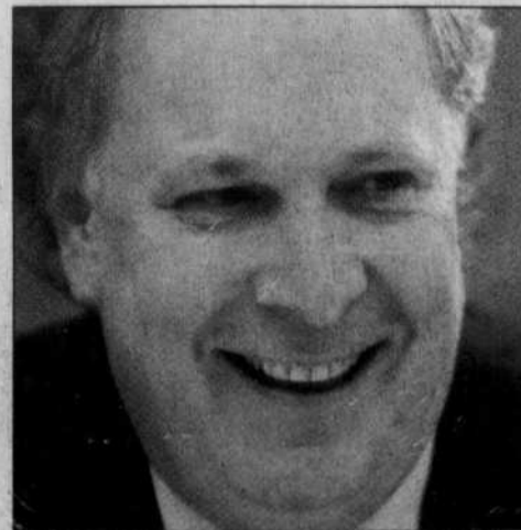
Jean Charest, André Boisclair et Mario Dumont ont estimé hier que le budget Flaherty représentait un gain pour le Québec.

C'est un Jean Charest souriant qui a réagi hier au budget Flaherty. «On a fait un très grand pas aujourd'hui sur le déséquilibre fiscal», a-t-il affirmé en soulignant que les Québécois sont les «grands gagnants». Il a soutenu en anglais que les résultats obtenus montrent à quel point le fédéralisme est flexible et rentable lorsque l'on fait preuve de leadership.