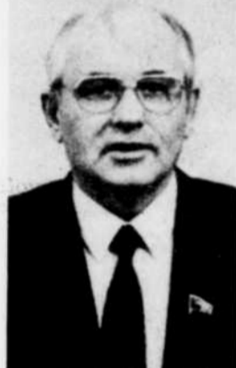
Mikhail Gorbatchev du "parlement du parti", un bilan morose de la perestroïka