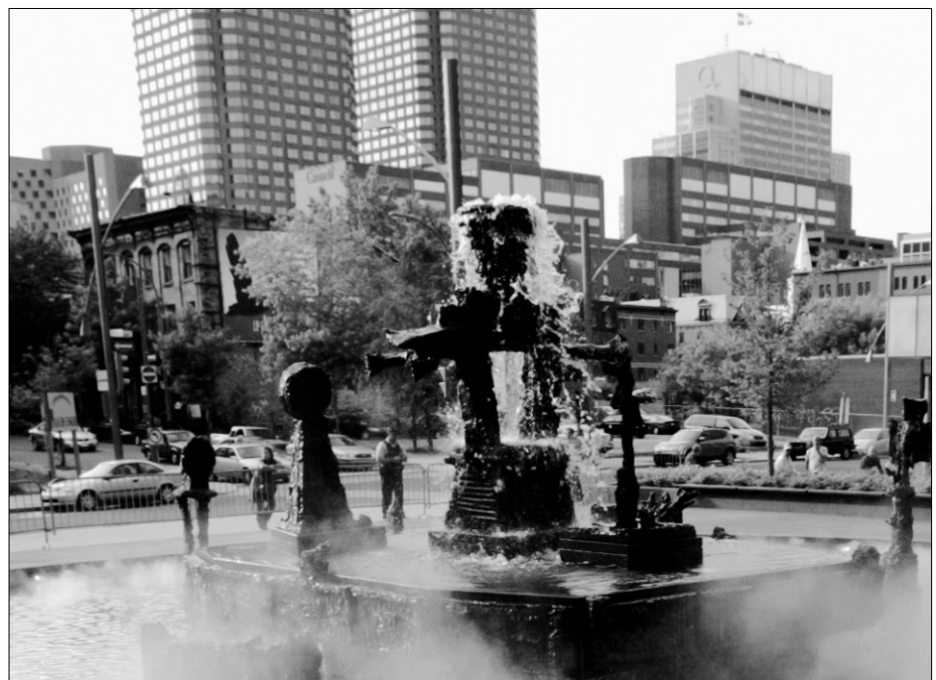
La place Jean-Paul-Riopelle.