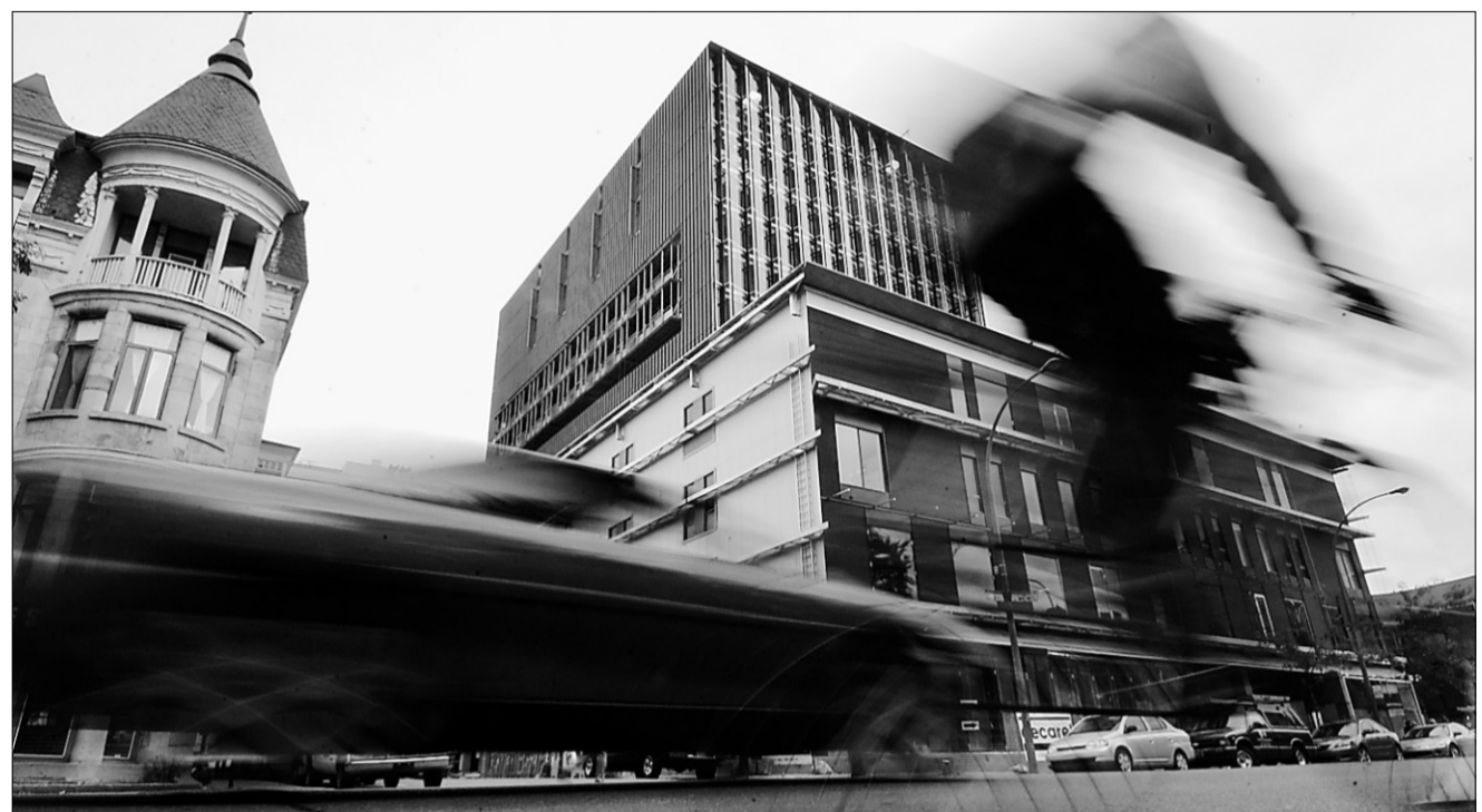
L'ancien et le «nouveau»: l'ITHQ rue Saint-Denis.