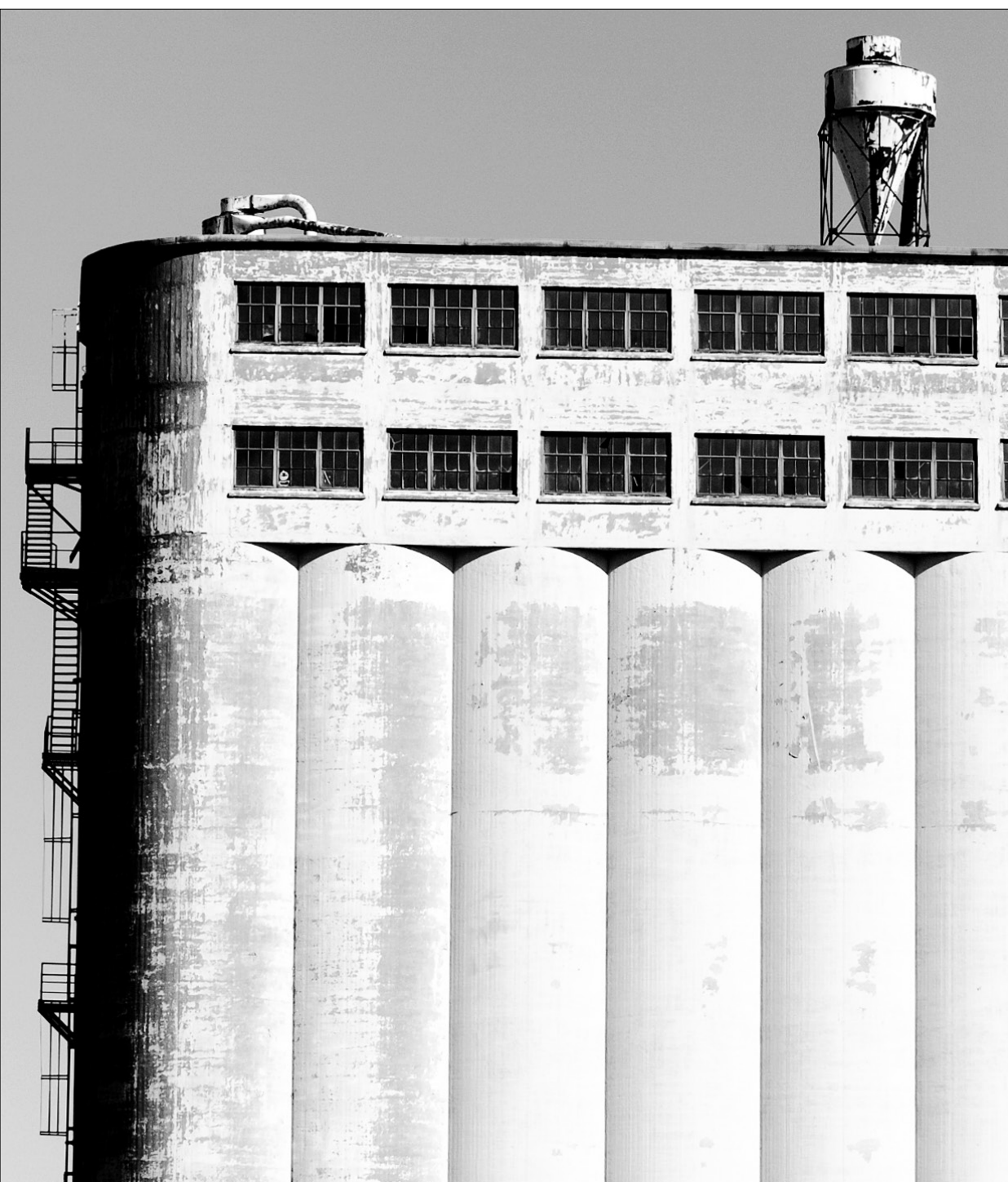
Le silo n°5.