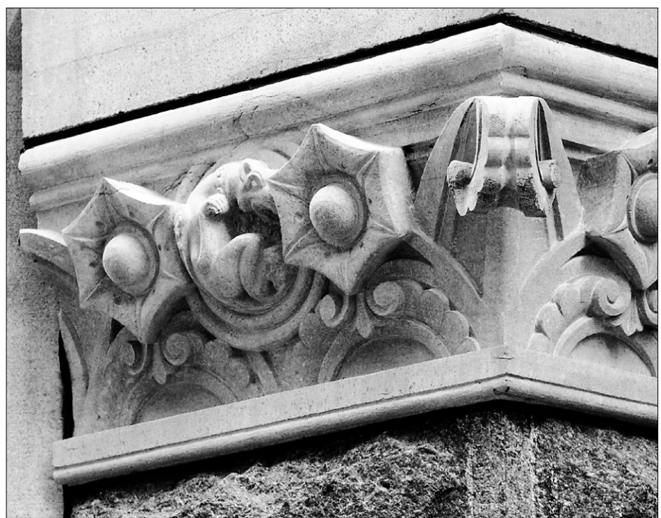
Chapiteau, rue de la Commune.