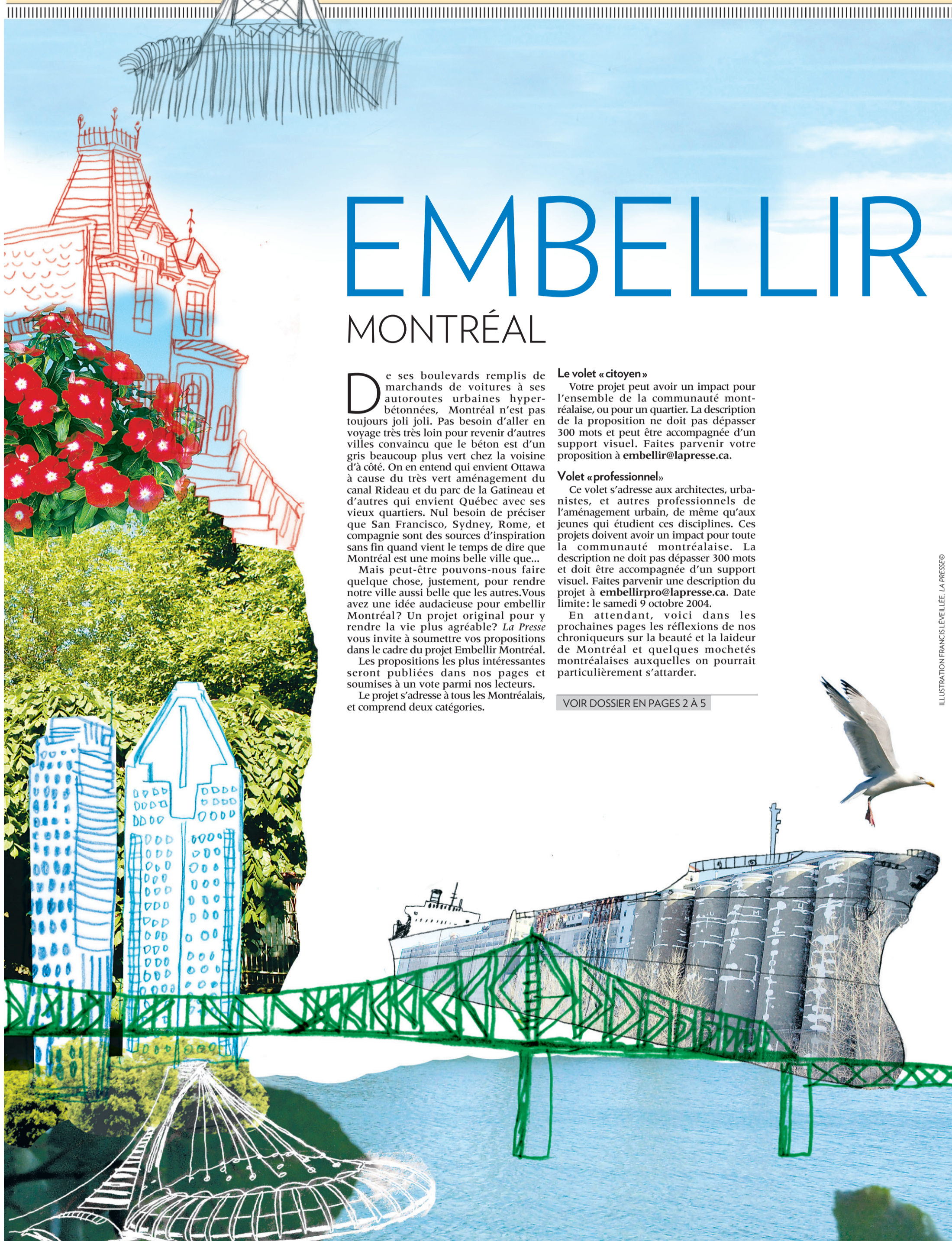
ILLUSTRATION FRANCIS LEVIELLE, LA PRESSE