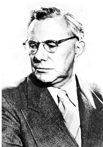
L'université consacre une école d'été au théologien et philosophe Paul Tillich.

Deux écoles d'été du côté de la Faculté des lettres et sciences humaines égale-