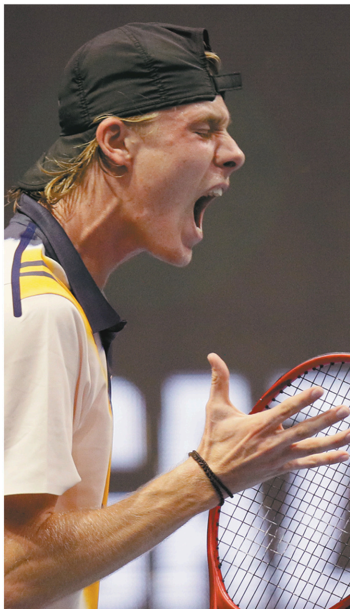
En deuxième ronde, Shapovalov croisera le fer avec l'italien Matteo Berrettini.