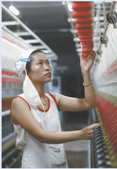
Une employée dans une manufacture de textile à Huaibei, en Chine