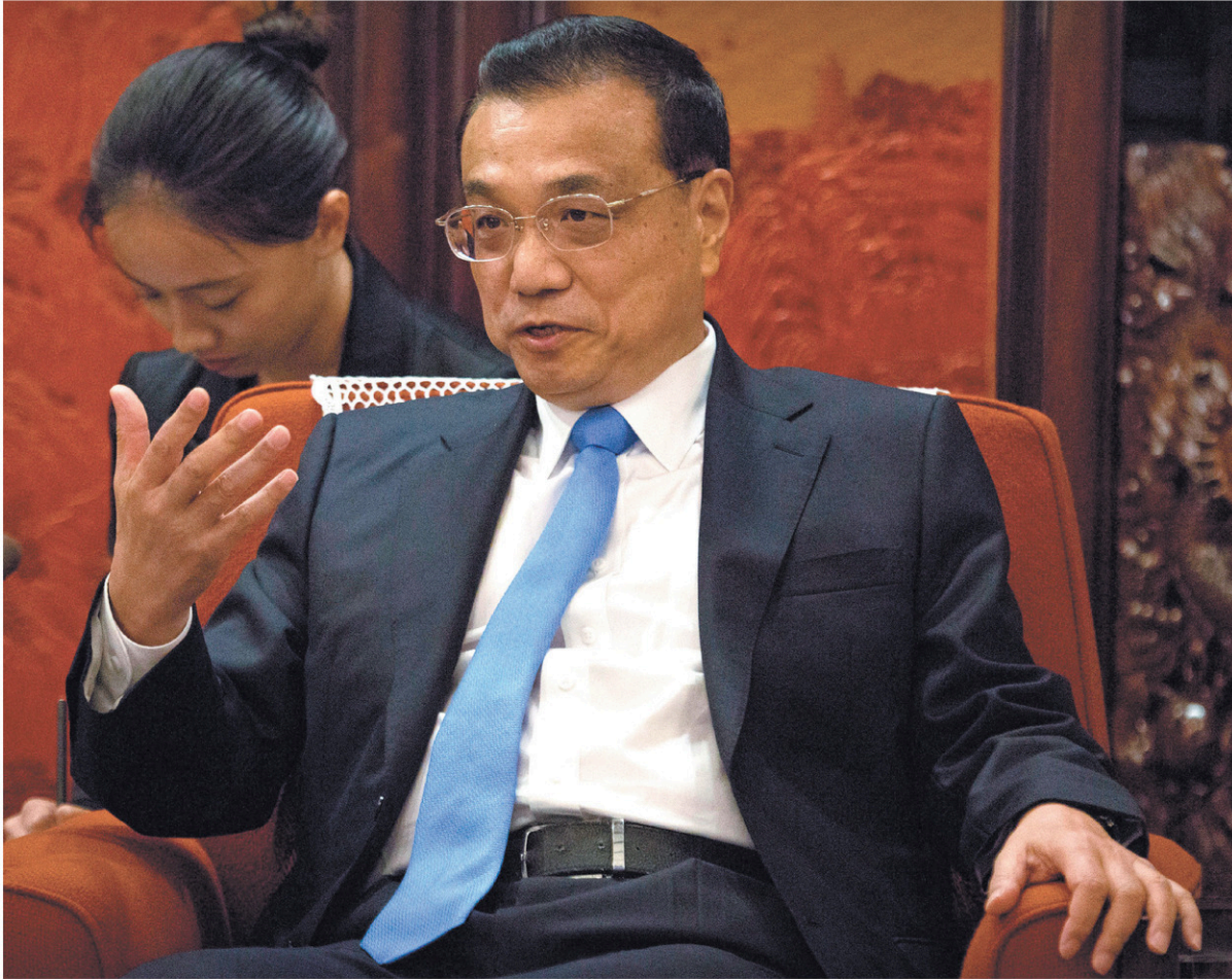
Le premier ministre chinois, Li Keqiang, le 7 septembre

Face au protectionnisme de Washington, Pékin s'affiche volontiers en héraut du libre-échange