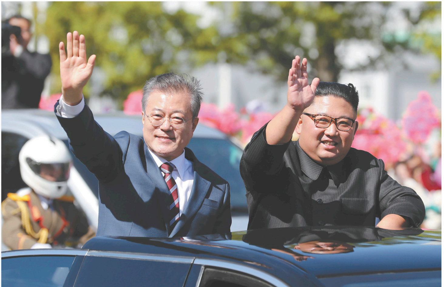
Le dirigeant nord-coréen, Kim Jong-un (à droite), accueille le président sud-coréen, Moon Jae-in, à Pyongyang depuis mardi.

Sur vingt enfants de moins de cinq ans, au moins un souffre de malnutrition aiguë sévère à Hodeida, selon l'UNICEF. Plus de 11 millions d'enfants, soit 80 % des enfants du pays, ont « un besoin désespéré d'assistance humanitaire », d'après la même source.