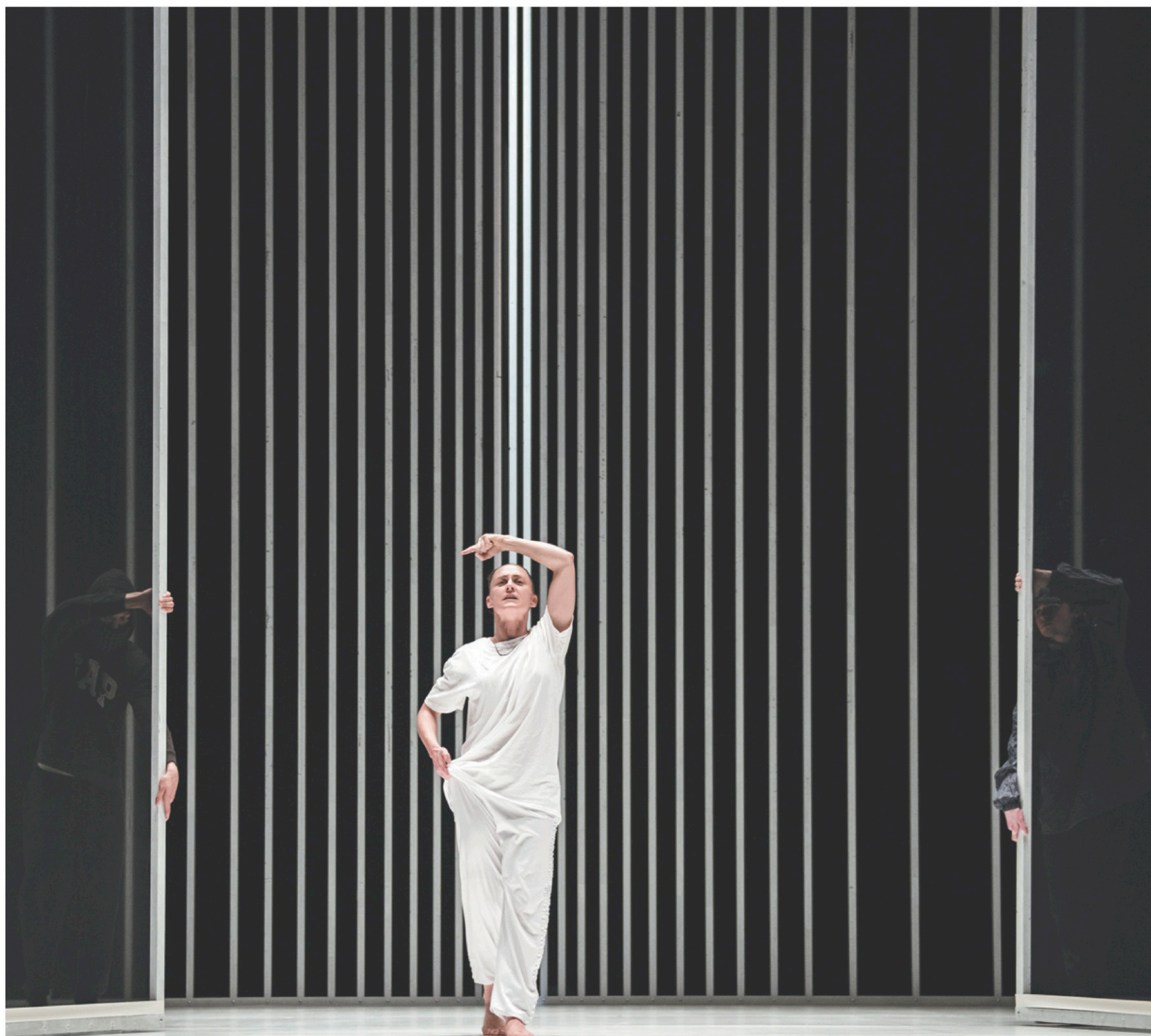
La chorégraphe nord-irlandaise Oona Doherty s'est approprié avec brio le solo ponctué de mimiques et postures typiquement masculines récupérées des jeunes des quartiers chauds de Belfast, mais où se loge également une vulnérabilité et une certaine douceur.