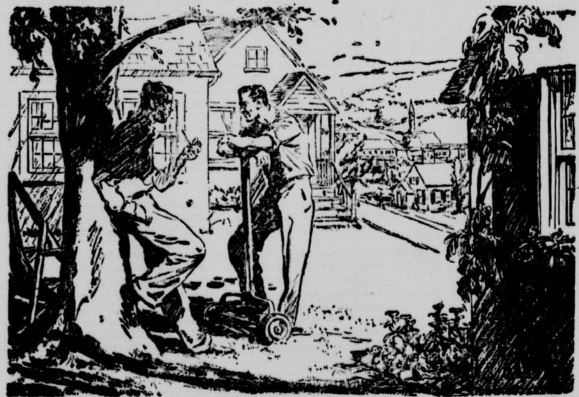
LES CANADIENS ET LEURS INDUSTRIES—ET LEUR BANQUE