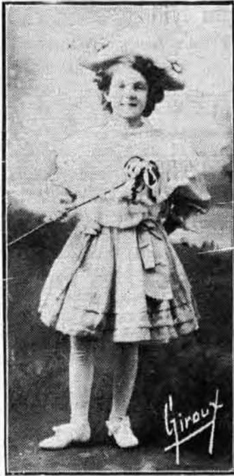
LA PETITE AUGUSTINE