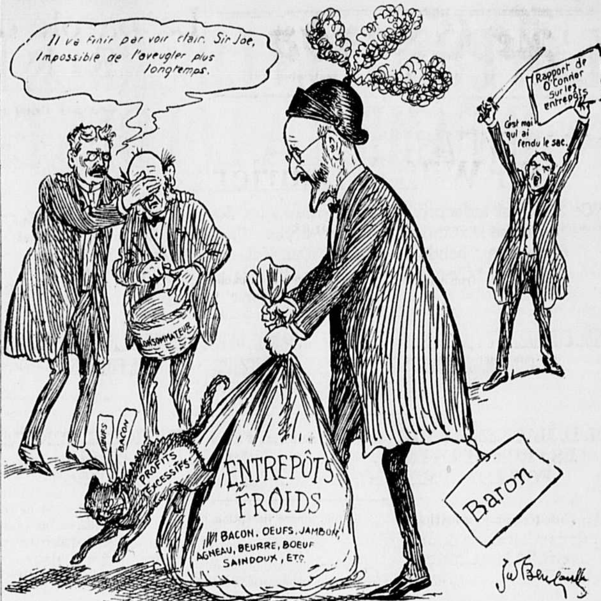
Le chat est enfin sorti du sac.

SUR LE PONT VICTORIA Le secrétaire de l'Automobile Club of Canada attire l'attention des autorités du Grand-Tronc, sur l'état du pontage destiné aux voitures, sur le pont Victoria. Recem-