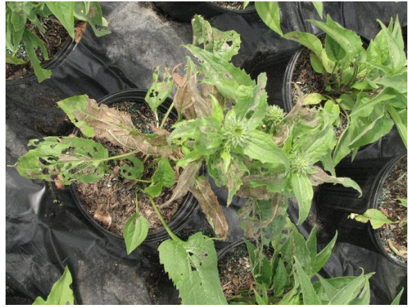
Dommages de diacrisie sur Echinacea .