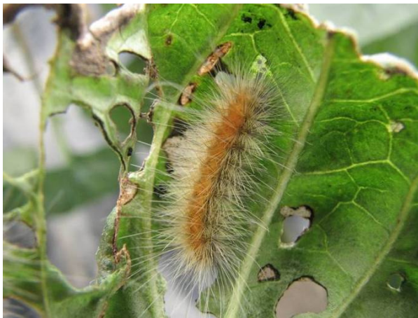
Stade larvaire avancé de couleur brun-jaune de la diacrisie de Virginie.