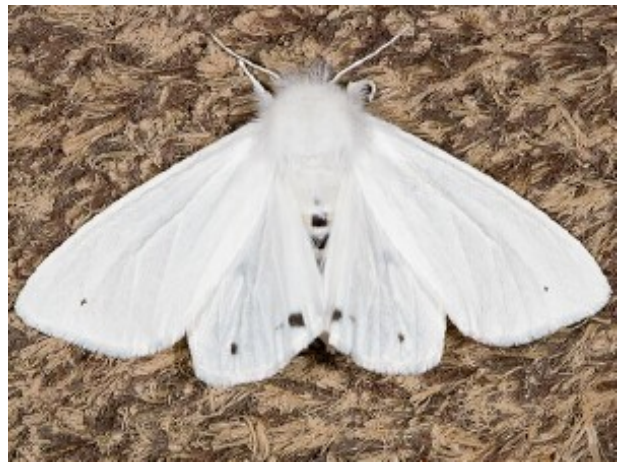
Adulte de la de diacrisie de Virginie.