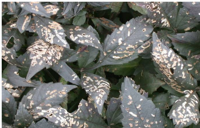
Dommages d'altises.