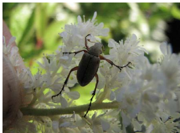
Scarabées du rosier sur lilas 'Ivory Silk'.