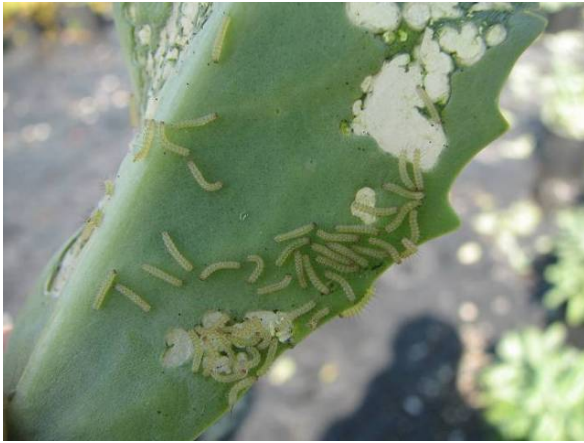
Larves de diacrisie et dommages sur Sedum .