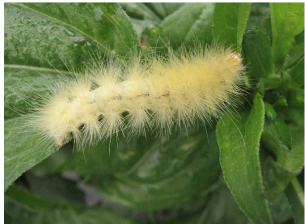
Stade larvaire avancé de couleur blanche de la diacrisie de Virginie.