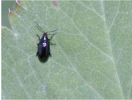
Adulte de l'altise à tête rouge.