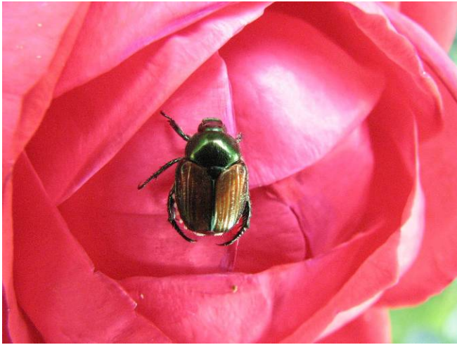
Scarabée japonais adulte.