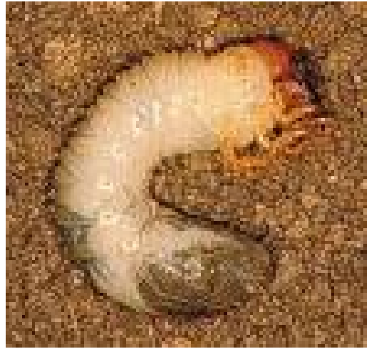
Scarabée japonais (larve).