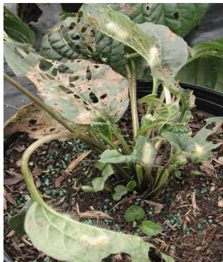
Domages causés par la diacrisie de Virginie sur Rudbeckia .

Aucun produit n'est homologué contre cet insecte