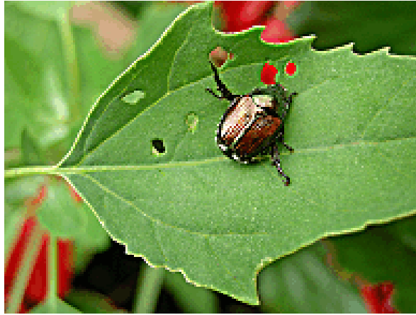
Domages du scarabée japonais.