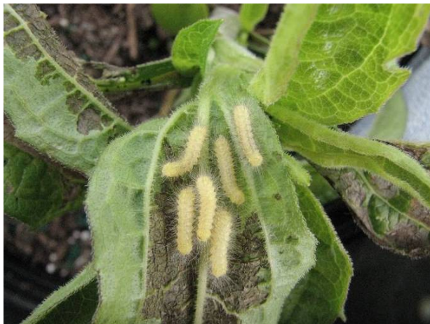
Stade larvaire avancé de couleur blanche de la diacrisie de Virginie.