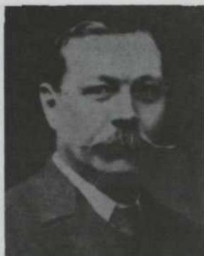
Sir Arthur Conan Doyle (1859-1930)