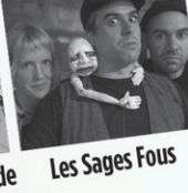
Les Sages Fous