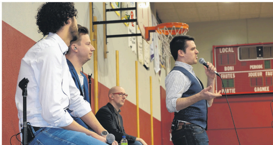
QW4RTZ en conférence à Keranna.

«Contrairement à une conférence jeunesse typique, on est juste quatre gars ordinaires qui ont eu des adolescences tout à fait ordinaires, mais il n'y a pas vraiment d'adolescence ordinaire. Dans la tête de tous les jeunes, ils vivent quelque chose d'unique et ils ont l'impression