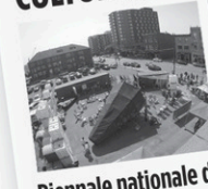
Biennale nationale de sculpture contemporaine