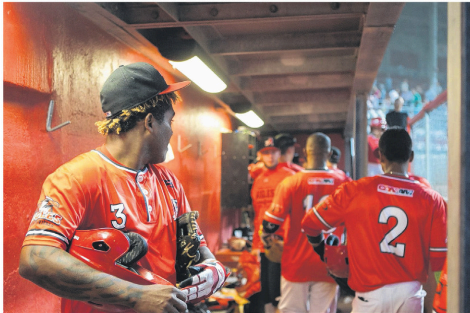
Des joueurs des Aigles cherchent un foyer en vue de la prochaine saison.

«On avait un contrat avec les résidences de l'UQTR, mais il est maintenant échu. Nous sommes en négociation», dit-il. Il faut savoir que l'organisation paye une partie de la résidence, alors plus il y aura de joueurs placés, moins élevés seront les coûts. «L'organisation de Winnipeg fait ça depuis des années et Ottawa a adopté ça dès son entrée.»