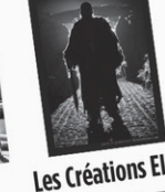
Les Créations Eldar