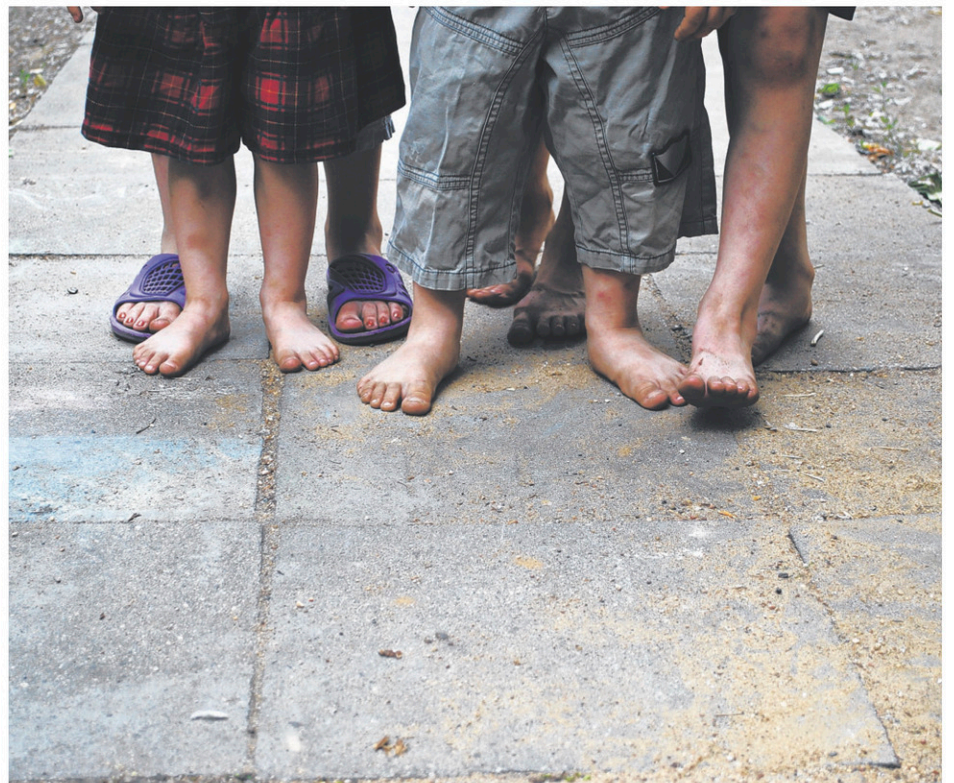
Plusieurs des réfugiés syriens qui ont posé bagages à Trois-Rivières en 2016 sont arrivés dans la Cité de Laviolette avec un préavis de 24h à 48h à peine.

Le jeune homme de 28 ans se demande si, dans une certaine mesure, il n'y a pas eu une forme de désinformation de la part des médias.