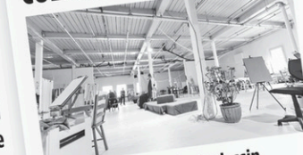
De la Factorie du dessin