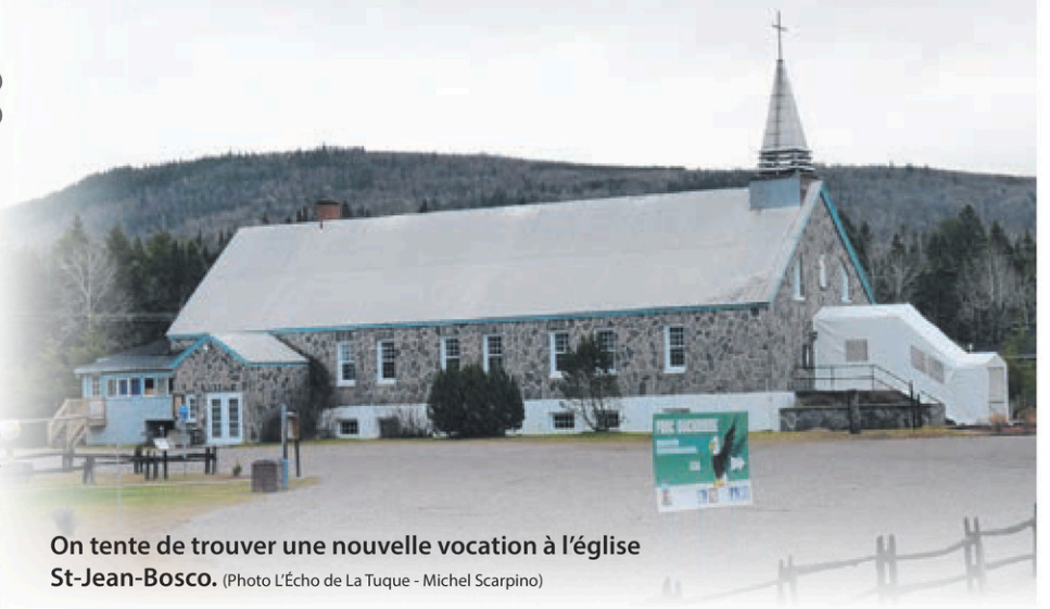
On tente de trouver une nouvelle vocation à l'église St-Jean-Bosco.

En août, si le projet est viable, cette corporation pourrait prendre la relève. Elle bénéficierait d'une enveloppe annuelle allouée par la fabrique de 2000 $, pour conserver un lieu de culte, pour des funérailles ou autres événements spéciaux. Mais les célébrations eucharistiques n'y seront plus présentées de façon régulière, comme c'était le cas auparavant. Avec l'arrivée d'une nouvelle coopérative, la paroisse «deviendrait non propriétaire des lieux, mais une voix au conseil d'administration et un locataire parmi d'autres pour partager les lieux, apportant une contribution proportionnelle à 33% des montants de CVA reçus des paroissiens de La Bostonnais plus 100% des quêtes de funérailles s'il se trouve encore possible d'utiliser les lieux pour cela», peut-on aussi lire sur la page Facebook de la paroisse St-Marin-de-Tours.