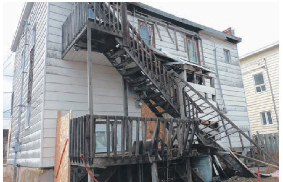
Le bâtiment du 328, rue Tessier est dans un état de délabrement qui fait peur aux voisins. Fort heureusement, il sera éventuellement démolie.

« Jusqu'à maintenant, il en a coûté environ 50 000 $ à Ville de La Tuque pour des cas de nuisance et les bâtiments vétustes, en tout. Nous