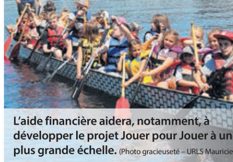
L'aide financière aidera, notamment, à développer le projet Jouer pour Jouer à une plus grande échelle.

ÉCONOMIE. L'Unité régionale de loisir et de sport (URLS) de la Mauricie s'est vue octroyer une aide de 290 000 $ via le soutien aux communautés locales en loisir actif et saines habitudes de vie. Elle pourra développer, entre autres, son projet Jouer pour Jouer à une plus grande échelle.